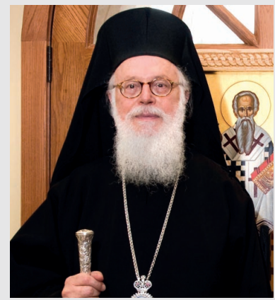
Ὁ Ἀρχιεπίσκοπος Ἀλβανίας κ. κ. Ἀναστάσιος

τὰ «τερτίπια» τῶν Ἀλβανῶν, ἦταν μιὰ ἀτράνταχτη ἀπόδειξις τῆς νοθείας τῶν ἐκλογικῶν ἀποτελεσμάτων. Ἐν προκειμένῳ, ὅμως, ὑπάρχει εὐθύνῃ καὶ στὴν ἡγεσίᾳ τῆς Ἐθνικῆς Κοινότητος, μέσα, ἀλλὰ καὶ στοὺς ἐν Ἑλλάδι Βορειοηπειρώτες, ποὺ δὲν ὑπῆρξε μαζικὴ κινητοποίηση. Ἄς μὴν ἐπαναπαυώμαστε στὰ παλαιότερα στοιχεῖα. Κί ἄς μὴ μᾶς διαφεύγη ὅτι οἱ Ἀλβανοὶ, ὡς «καραμπινάτοι» ἀνθέλιγνοι, βυσοδομοῦν πάντοτε εἰς βάρος τῶν Βορειοηπειρωτῶν. Οἱ καιροὶ τρέχουν καὶ δὲν μᾶς περιμένουν. <B.B.>