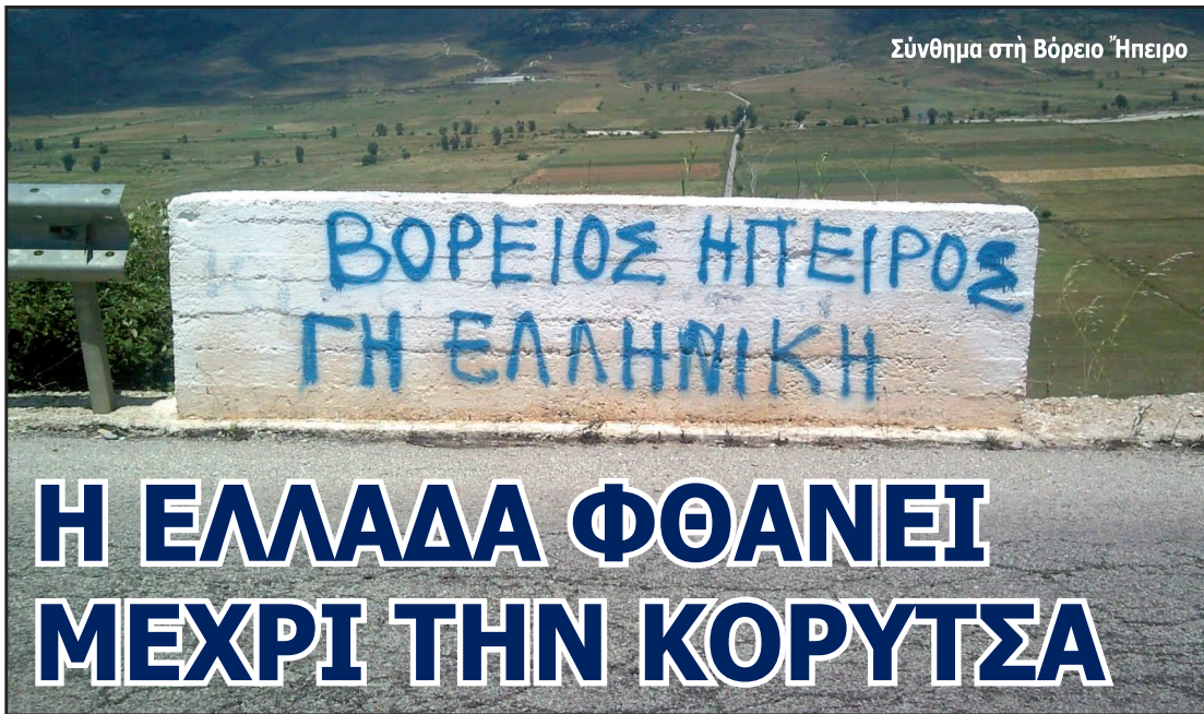
Σύνθημα στη Βόρειο Ήπειρο

Στις 28-11-2012 ο Άλβανός πρωθυπουργός Σαλί Μπερίσα σε δηλώσεις του στην Αύλινα της Βορείου Ήπειρου, έβγαλε από την φαρέτρα του το βέλος του «άλυτρωτισμού» και «χτύπησε» μιλώντας για «ιστορικούς» άγώνες περι άνεξαρτησίας όλων των άλβανικών έδαφών, από την Πρέβεζα στο Πρέσεβο και από τα Σκόπια μέχρι την Ποντοκόριτσα.