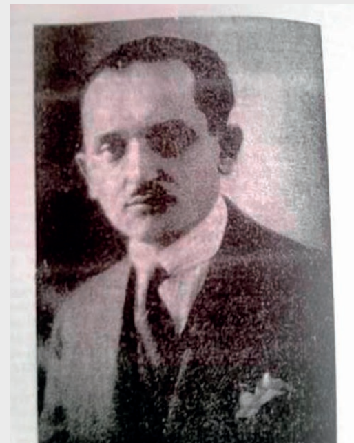
Ο ήγέτης της Μ.Α.Β.Η. Βασιλείος Σαχίνης που βασανίστηκε απάνθρωπα και εκτελέστηκε από τους Άλβανούς