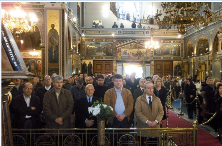
Πλήθος κόσμου ἀλλά και μέλη τοῦ ΠΑΣΥΒΑ και τῆς ΣΦΕΒΑ παρέστησαν στο μνημόσυνο τοῦ ἱδρυτοῦ και ἀρχηγοῦ τους.

Ὁ Μνηστήρος Μητροπολίτης Δρυϊνουπόλεως Πωγωνιανῆς και Κονίτσης κυρός Σεβαστιανός δέν διακρίθηκε μόνο επειδή πέτυχε νὰ εἶναι συνεπής στην ἄσκηση τῶν ποιμαντορικῶν του καθηκόντων, οὔτε επειδή φρόντιζε νὰ ἐκπληρώνει πάντοτε στο ἀκέραιο τις ὑποχρεώσεις του ἀπέναντι στο εὐλαβές ποιμνίό του (Γηροκομείο, Οἰκοτροφεία Ἀρρένων-Θηλέων, Πνευματική Στέγη). Εἶναι ἀλήθεια ὅτι δέν καταπάτησε μονομερῶς με τήν ὑλοκοτηνική ἀνάπτυξη τῆς φτωχῆς του ἐπαρχίας, οὔτε ἀσχολήθηκε μονάχα με τὸν πνευματικό καθαρισμό τῶν εὐσεβῶν χριστιανῶν τῆς μητροπόλεώς του.