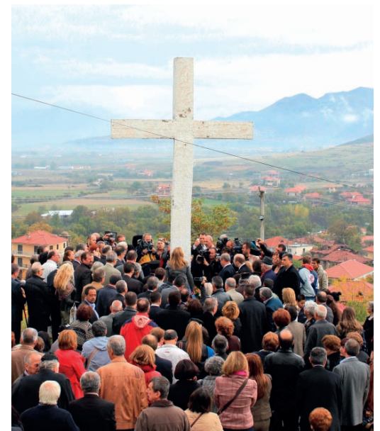
Κατάθεση στεφάνων στὸ μνημεῖο στὴν Μμπομποσίτσα

Τέλος, κλιμάκιο τῶν συλλόγων μας συμμετεῖχε στὴς ἐκδηλώσεις στους Βουλγαράτες, ὅπου καί ὑπάρχει τὸ μοναδικὸ (δυστυχῶς) ὀργανωμένο στρατιωτικὸ νεκροταφεῖο.