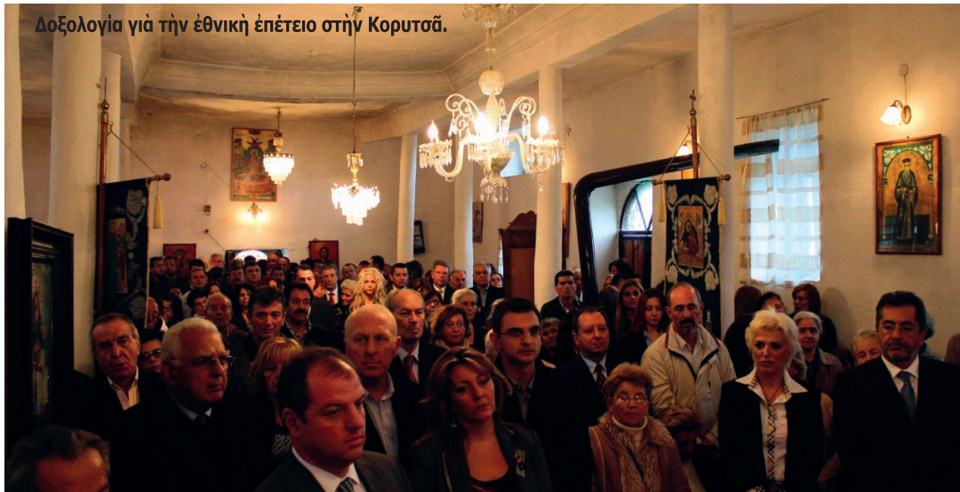
Δοξολογία για την εθνική επέτειο στην Κορυτσά.

Γράφει: ο Φιλόθεος Κεμετσεντζίδης Πρόεδρος Σ.Φ.Ε.Β.Α. Θεσσαλονίκης