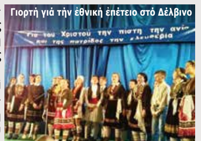
Γιορτὴ γιὰ τὴν ἐθνικὴ ἐπέτειο στὸ Δέλβινο