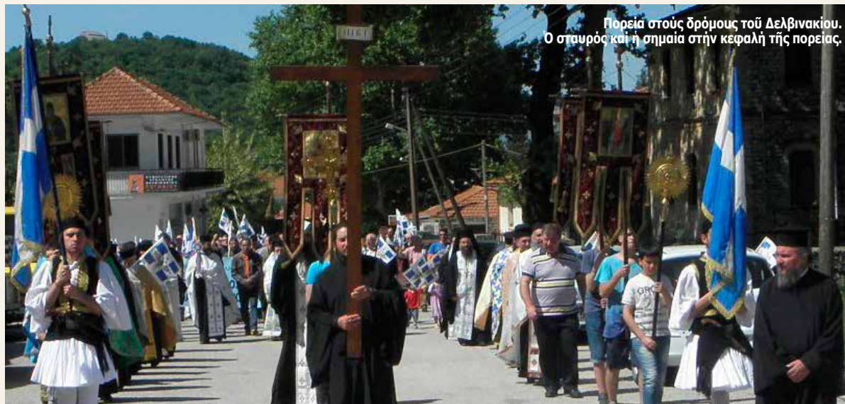
Πορεία στοὺς δρόμους τοῦ Δελβινακίου. Ὁ σταυρὸς καί ἡ σημαία στήν κεφαλὴ τῆς πορείας.

ἀπὸ τὴν ἀντιπολίτευσι, τὴν μείζονα καί τὴν ἐλάσσονα. Τὸ μόνο μέλημα τοῦ πολιτικοῦ μας κόσμου εἶναι ἡ εὐρωζώνη, τὸ εὐρῶ, κάποια δισεκατομμύρια ἐνός ἀναμενομένου δανείου, πού ἀναμένεται, πού ἔρχεται, ἀλλὰ δέν ἔχει ἔρθει ἀκόμη, καί δέν ξέρουμε ἂν θά ἔρθει. Κατὰ τὰ ἄλλα γιὰ τοὺς πολιτικούς μας «γαῖα, πυρὶ μειχθῆτω». Δηλαδή, νά γίνουν «ὅλα λίμπα», ἀρκεῖ νά πάρουμε τὰ δισεκατομμύρια. Ὅμως, ὡς πότε θά κοιμᾶται «τὸν νῆδυμον» ὁ πολιτικός μας κόσμος ; Ὡς πότε θά κλείνει μάτια καί αὐτὰ στοῦ συνεχιζόμενο δράμα τῶν βορειοηπειρωτῶν; Καί νά τανε μόνον τὸ ζήτημα αὐτό; Ποῦ ἡ Θράκη ; Ποῦ τὸ Αἰγαῖο ; Ποῦ τὰ Ἴμια ; Ποῦ ἡ Κύπρος ; Ποῦ οἱ στρατιές τῶν λαθρομεταναστῶν; Ποῦ οἱ κουκουλοφόροι ἀναρχικοί, πού ἀσύστολα καί ἀνεμπόδοιστα βεβηλώνουν τὰ μνημεῖα τοῦ ἔθνους ; Ποῦ τὰ ναρκωτικά πού μᾶς ἔρχονται κατὰ τόνους κυρίως ἀπὸ τὴν Ἀλβανία ; Ποῦ ἡ διαφθορά καί ἡ διασπάθισι τοῦ δημοσίου χρημάτος; Ἀλλὰ, βλέπετε, ὅλα αὐτὰ δέν εἶναι στὰ ἐνδιαφέροντα τῶν πολιτικῶν. Ἡ προβολὴ τῶν ὁμοφυλοφίλων καί τὸ ἀνοιγμα τῶν καταστημάτων τὴν Κυριακὴ, «μᾶς μάραναν». Αὐτὰ μας λείπανε καί θά μᾶς τὰ φέρουν καί αὐτὰ. Δυστυχῶς, ἀσχολοῦμεθα «μέ τὸ ἄνηθον καί τὸ κύμινον» (Ματθ., κγ' ,23) καί ἀφήνουμε « τὰ βαρύτερα τοῦ νόμου», δηλαδή τὰ