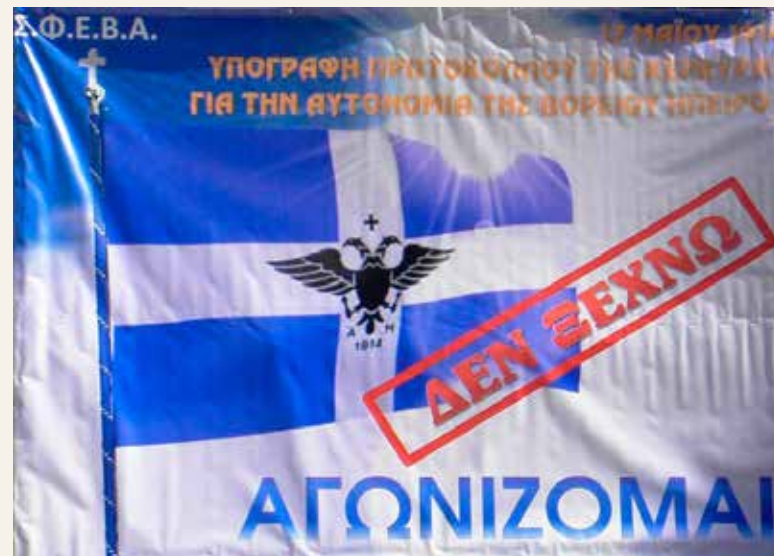
Τὸ κεντρικὸ πανὸ τῆς ἐκδήλωσις

Τὸ πρῶτο εἶναι ἡ προσπάθεια τῶν Ἀλβανῶν νά ἀφαιρέσουν ἕνα τμήμα τοῦ περιβάλλου τοῦ ἐπιβλητικοῦ Ὀρθόδοξου Μητροπολιτικοῦ Ναοῦ τῶν Τιράνων. Ὅπως ἔγραψε ἡμερήσια ἀθηναϊκὴ ἐφημερίδα, οἱ Ἀλβανοὶ ἀφῆρσαν τὴν περιφραξὴ τοῦ περι-