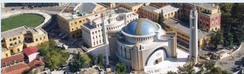
Ὁ ναὸς τῆς Ἀναστάσεως τοῦ Χριστοῦ στὸ κέντρο τῶν Τιράνων