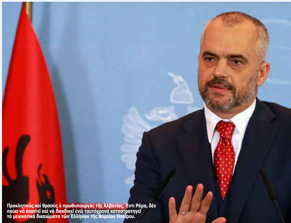
Προκλητικός και θρασύς ό πρωθυπουργός τής Αλβανίας, Έντι Ράμα, δέν παύει να άπαιτεί και να διεκδικεί ενώ ταυτόχρονα καταστρατηγεί τά μειονοτικά δικαιώματα των Έλλήνων τής Βορείου Ήπειρου.

Αύτή ή μυωπική στάση έφτανε στην ...επένδυση έλπίδων πως ή άλλαγή Κυβερνήσεων θα άλλαζε (άν είναι δυνατόν...) τήν διάθεση άνθελληνισμού των Κυβερνήσεων των Τιράνων άπέναντι στην Ελλάδα. Για να έλθει μετά ή ήχηρή διάψευση από τήν πραγματικότητα. Τά ίδια συμπεράσματα προκύπτουν και από τήν πρόσφατη επιθετικότητα από τήν Κυβέρνηση του Σοσιαλιστή Έντι Ράμα, που άπειλεί τούς πάντες και τά πάντα θέλοντας να μετατρέψει τά Βαλκάνια σε χώρο πραγμάτωσης των σχεδίων περι ... Μεγάλης Αλβανίας. Από τόν Έλλαδικό τύπο (που συνεχίζει να μιλά για «Έλληνες τής Νότιας Αλβανίας» και όχι τής Βορείου Ήπειρου, ρίχνοντας άμέτρητο νερό στόν μύλο του Αλβανικού Μεγαλοϊδεασμού και ξεσχίζει κάθε σελίδα Ιστορικής αλήθειας) άντλοΰμε τά παρακάτω. Ο Θάνος Ντόκος (ειδικός στην Διπλωματία και Πρόεδρος του ΕΛΙΑΜΕΠ) μέ άρθρο του (στην ΚΑΘΗΜΕΡΙΝΗ τής 3ης Ιουνίου 2015 και τίτλο «Νέοι "πονοκέφαλοι" στα