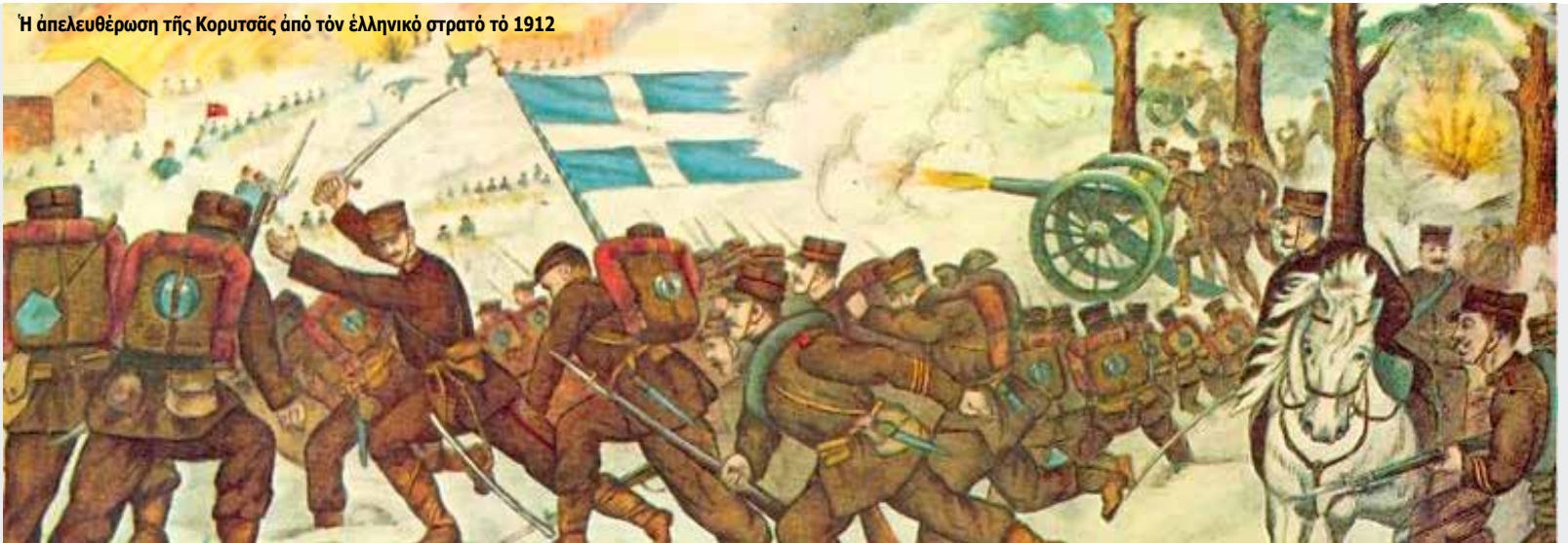
Ἡ απελευθέρωση τῆς Κορυτσᾶς ἀπὸ τὸν ἑλληνικὸ στρατὸ τὸ 1912

Βόρειος Ήπειρος ὀνομάζεται τὸ βόρειο τμήμα τῆς Ήπειρου πού τελεῖ ἀκόμη καὶ σήμερα ὑπὸ ἀλβανική κατοχή, παρόλο πού τὴν πρώτη πεντηκονταετία τοῦ 20οῦ αἰῶνα ἀπελευθερώθηκε τρεῖς φορές. Γιά πρώτη φορά ἀπελευθερώθηκε μετὰ τοὺς Βαλκανικοὺς πολέμους. Τὸ 1912-13 οἱ ἑλληνικὲς στρατιωτικὲς δυνάμεις ἐλευθέρωσαν πόλεις καὶ χωριά ὅλης τῆς, ἐνιαίας τότε, Ήπειρου. Ἡ ἐλευθερία ὅμως δὲν κράτησε γιά πολύ. Κι αὐτὸ γιατί οἱ Μεγ. Δυνάμεις μετὰ τὸ Πρωτόκολλο τῆς Φλωρεντίας (17 Δεκεμβρίου 1913) προσήρτησαν στὸ κράτος τῆς Ἀλβανίας, πού οἱ ἴδιες εἶχαν ἰδρύσει στὶς 29 Ἰουλίου 1913, τὸ βόρειο κομμάτι τῆς Ήπειρου. Οἱ γνήσιοι πατριῶτες, ὅμως, μπροστά σ' αὐτὴν τὴν κατάσταση, δὲν ἔμειναν ἄπραγοι. Δημιούργησαν κυβέρνηση καὶ κήρυξαν στὶς 17 Φεβρουαρίου 1914, στὸ Ἀργυροκάστρο, τὴν Αὐτονομία τῆς Βορ. Ήπειρου. Ὁ τρίμηνος ἀγώνας πού διεξήχθη ὑπὸ ἀντίξοες συνθήκες, στέφθηκε τελικά ἀπὸ ἐπιτυχία. Ἔτσι στὶς 17 Μαΐου 1914 ὑπογράφεται καὶ ἀπὸ τὴν Ἀλβανία τὸ Πρωτόκολλο τῆς Κερκύρας πού κατοχυρώνει αὐτὴν τὴν Αὐτονομία. Ἡ ἔνταση βέβαια στὴν Ἀλβανία συ-