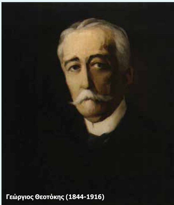
Γεώργιος Θεοτόκης (1844-1916)