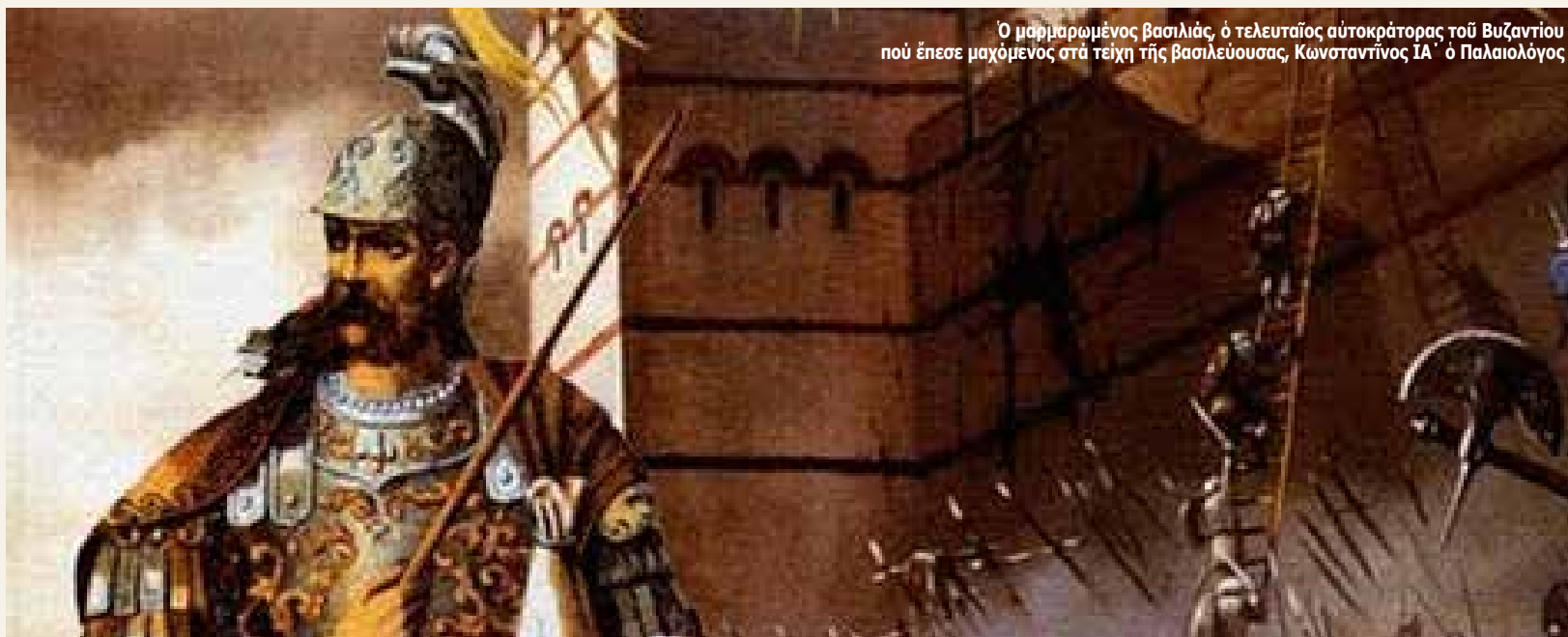
Ο μαρμαρωμένος βασιλιάς, ὁ τελευταῖος αὐτοκράτορας τοῦ Βυζαντίου πού ἔπεσε μαχόμενος στή τείχη τῆς βασιλεύουσας, Κωνσταντίνος ΙΑ΄ ὁ Παλαιολόγος

Ἡ ἡμερομηνία τῆς 29ης Μαΐου κατ’ ἔτος, φέρνει στό νοῦ κάθε καλοῦ Ἑλληνα, τίς τελευταῖες στιγμές καί τόν ἥρωικό ἀγώνα πού ἔδωσαν οἱ πρόγονοί μας στή μισογκρεμισμένα τείχη τῆς Κωνσταντινούπολης ὅταν ἀντιμετώπιζαν τόν Τούρκο κατακτητή. Ἡ Βασιλεύουσα μέ τά θεοφρουρήτα τείχη ἐκείνον τόν Μάιο τοῦ 1453 ἀποτελοῦσε «φάντασμα» τοῦ παλαιοῦ μεγαλείου τῆς καί λύγισε στίς συνεχεῖς ἐπιθέσεις τῶν φανατισμένων Ὀθωμανῶν. Ὁ τελευταῖος Αὐτοκράτορας Κωνσταντίνος ΙΑ΄, Παλαιολόγος, μέ λίγες χιλιάδες ὑπερασπιστές ἔδωσε ἕναν ἄνισο ἀγώνα καί ἔπεσε ἥρωικά σάν ἄλλος Λεωνίδα, στίς ἐπάλξεις τοῦ χρέους καί τῆς θυσίας.