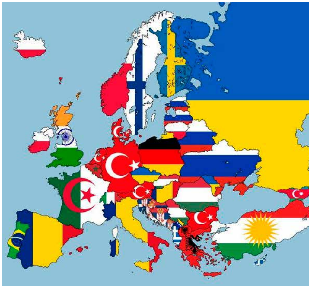
Χάρτης Εύρώπης. Μέ τή σημαία τής χώρας από όπου κατάγονται οι δεύτεροι σε πληθυσμό, άλλοδαποι πολίτες - κάτοικοι των χωρών, άναπα- ριστатели ή ανθρωπογεωγραφία τής Εύρώπης. Ο χάρτης περιλαμβάνει και τους πολίτες που βρίσκονται στη χώρα προσωρινά για έργασι. Κομβικός ο ρόλος του Βορειοηπειρωτικού Έλληνισμού.

έγγραφα και διατυπώσεις, τή στιγ- μή που ή Ιταλία βουλίαζε τά πλοία τους και ή Τουρκία δέν δέχτηκε ούτε έναν! Η Ελλάδα έχτισε δωρεάν στην Αλβανία νοσοκομεία, δημόσια κτίρια, έκκλησίες, ιδρύματα, περιέ- θαψε άσθενείς, προσέφερε τρόφι- μα και έξοπλισμό, ύποστήριξε την Αλβανία σε όλους τους διεθνείς όρ- γανισμούς. Τό «Εύχαριστώ» τής Αλ- βανίας και τής Διεθνούς Κοινότητας τό είσπράτουμε καθημερινά! Διαβάζουμε λοιπόν σε ιστοσελίδα τής άλβανικής διασποράς (Albanian Diaspora): «Καθολικισμός και Προ-