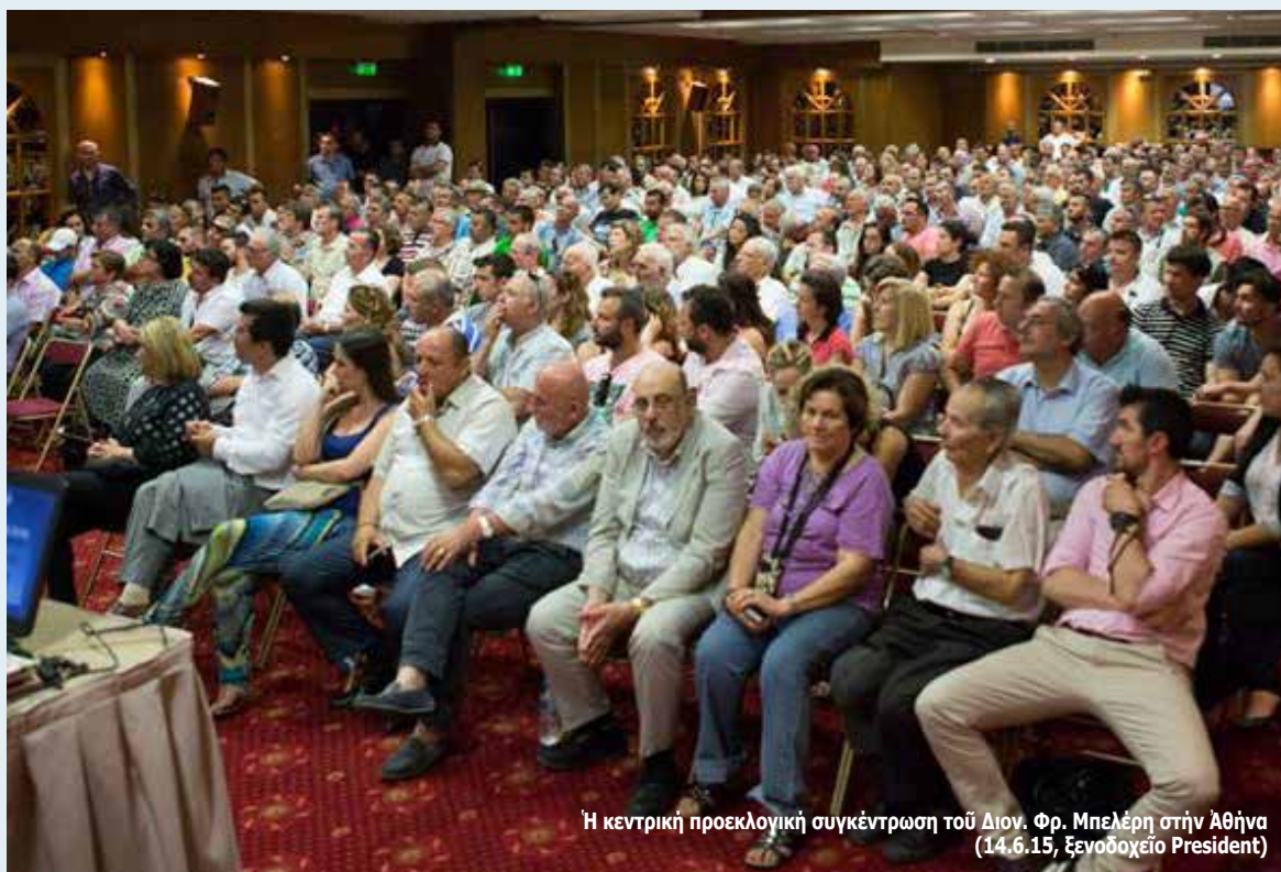
Ή κεντρική προεκλογική συγκέντρωση του Διον. Φρ. Μπελέρη στην Άθήνα (14.6.15, Ξενοδοχείο President)

Ή ανάγκη για ένότητα είναι δεδομένη περισσότερο από ποτέ και έναπόκειται στη νέα ήγεσία της ΟΜΟΝΟΙΑΣ και τον πρόεδρό της κ. Λεωνίδα Παππά να κάνει τα κατάλληλα βήματα, άργα αλλά σταθερά, για να ενώσει κατ' αρχήν τους πολιτικούς σχηματισμούς των Βορειοηπειρωτών, να επαναφέρει την πολιτική αξιοπιστία που τόσο τραυματίστηκε από τους ακροβατισμούς της ήγεσίας του ΚΕΑΔ, και να πετύχει την πολιτική εκπροσώπηση του ελληνισμού σε όλο τον άλβανικό Νότο όπως συνέβαινε από το 1991 ως το 1999 και όχι μόνο στην αναγνωρισμένη από τους Άλβανούς ως μειονοτική ζώνη. Στόν αγώνα αυτό, ό ΠΑ.ΣΥ.Β.Α. και ή Σ.Φ.Ε.Β.Α. αλλά και κάθε έθνικά σκεπτόμενος Έλληνας θα είναι στο πλευρό της ΟΜΟΝΟΙΑΣ.