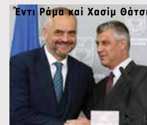
Έντι Ράμα και Χασίμ Θάτσι

Όπως αναφέρει ο άθηναϊκός Τύπος, «ο πρωθυπουργός τής Άλβανίας Έντι Ράμα προειδοποίησε, ότι εάν η Ευρωπαϊκή Ένωση συνεχίση να μην προωθή την ευρωπαϊκή όλοκλήρωση του Κοσσυφοπεδίου, ή ένωση τής Άλβανίας με