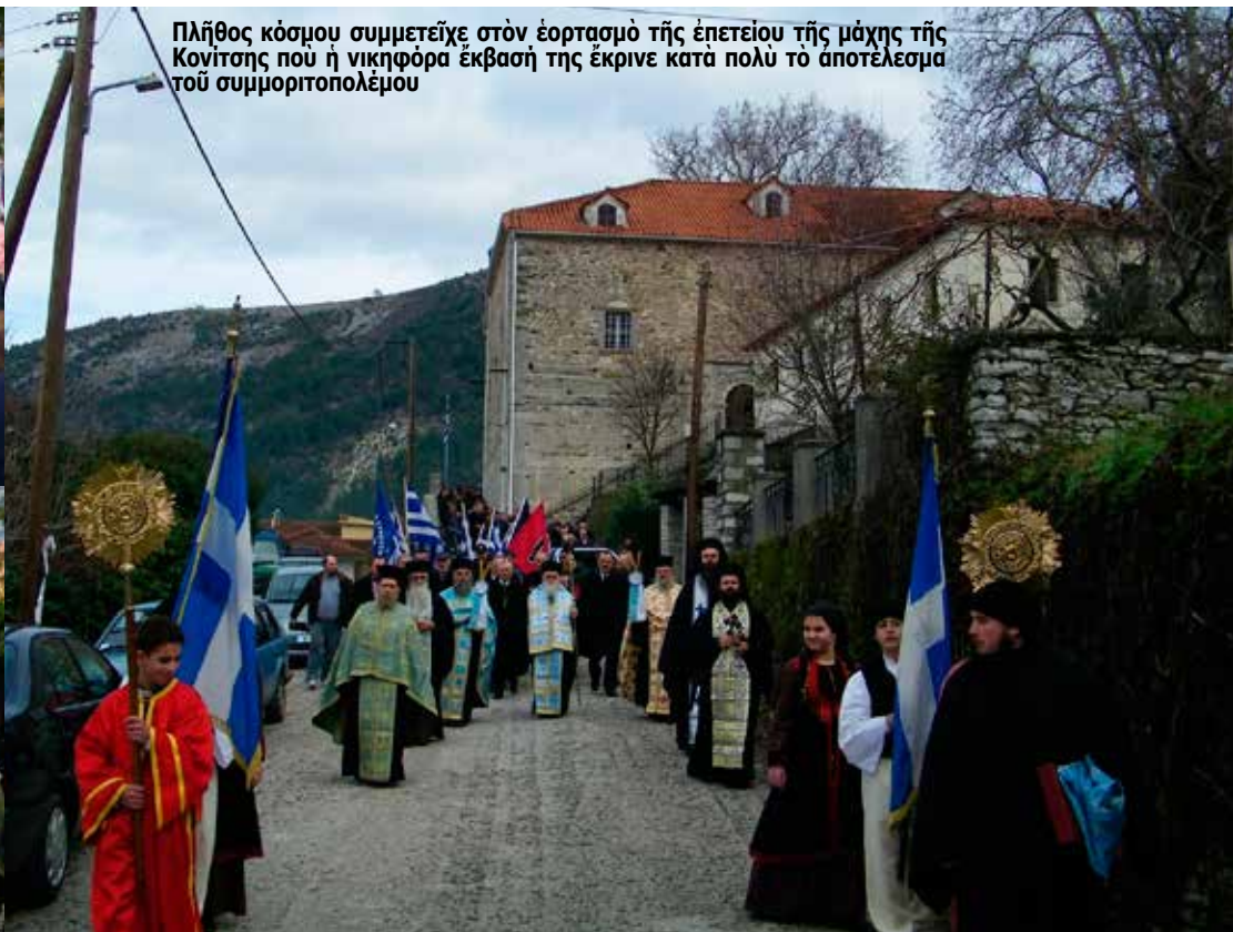
Πλήθος κόσμου συμμετείχε στον έορτασμό της επέτειου της μάχης της Κονίτσας που ή νικηφόρα έκβασή της έκρινε κατά πολύ το αποτέλεσμα του συμμοριτοπολέμου