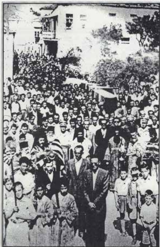
επιφορά των οστών των Προκρίτων το 1949 μετά την εκταφή.