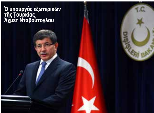
Ο υπουργός εξωτερικών της Τουρκίας Αχμέτ Νταβούτογλου

Γράφει ο Κωνσταντίνος Χολέβας, Πολιτικός Έπιστήμων