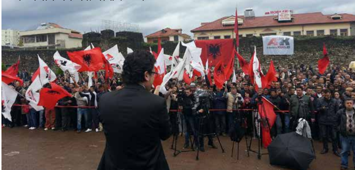
Έκδήλωση τής Έρυθρόμαυρης Συμμαχίας στο Έλβασάν