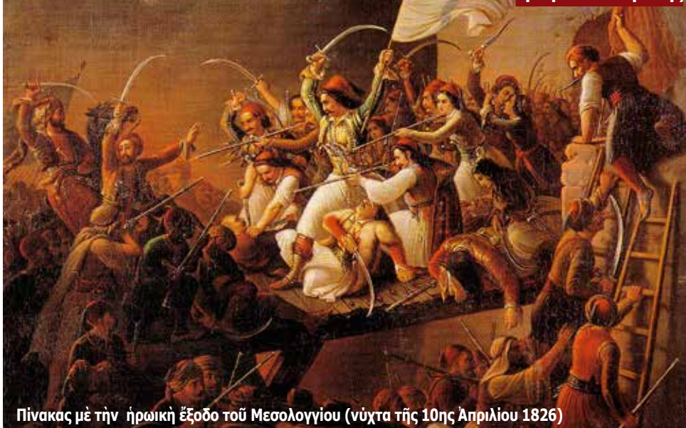
Πίνακας με την ήρωική έξοδο του Μεσολογγίου (νύχτα τής 10ης Απριλίου 1826)

Κάθε έθνος για να μπορέσει να έπιβιώσει θά πρέπει να μάθει την ιστορία του. Άν ξεχάσει τούς προγόνους του και άποκοπέι από τις ρίζες του τότε άργά ή γρήγορα θά εξαφανιστεί. Άξίζει λοιπόν να μαθαίνουμε την ιστορία μας, να τιμούμε τούς προγόνους μας και να προσπαθούμε καθημερινά να μιμούμαστε τις καλές ένεργειές τους και να άποφεύγουμε τά λάθη τους. Σ' αυτό τó άρθρο ή άναφορά δέν θά είναι γενική, άλλά ειδική.