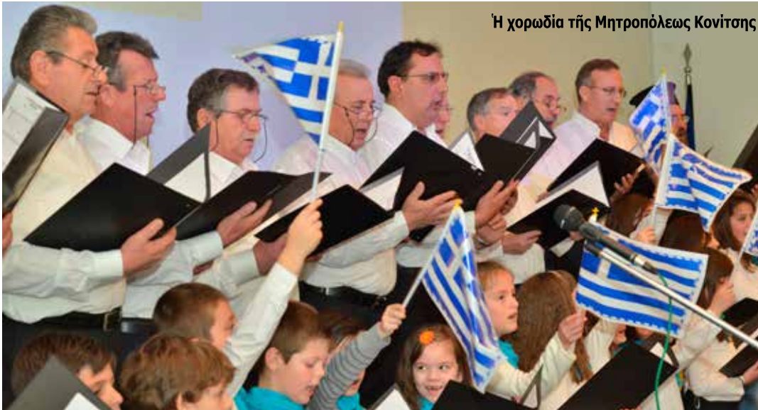
Η χορωδία της Μητροπόλεως Κονίτσας