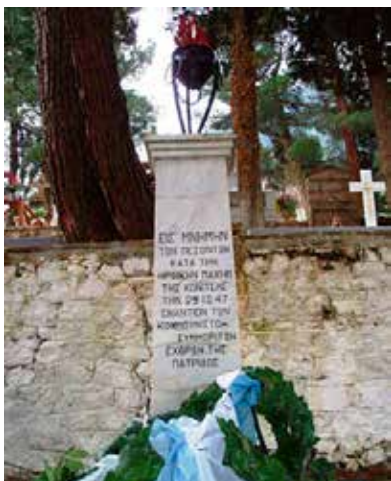
Το ήρωο στο νεκροταφείο των Έλλήνων στρατιωτών που έπεσαν κατά τη μάχη της Κονίτσας

Με λαμπρότητα και σεβασμό στη μνήμη των πεσόντων Μαχητών του Στρατού, της Χωροφυλακής, των Μ.Α.Υ και κατοίκων της Κονίτσας τελέστηκε την Κυριακή 13 Ιανουαρίου 2013 το έτησιο άρχιερατικό μνημόσυνο για την επέτειο της θρυλικής «Μάχης της Κονίτσας» με τους ξενοκίνητους κομμουνιστοσυμμορίτες που διήρκεσε από 25 Δεκεμβρίου 1947 έως 03 Ιανουαρίου 1948.