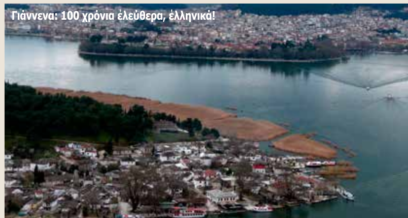
Γιάννενα: 100 χρόνια ἐλεύθερα, ἑλληνικά!

Ἀπὸ τὸ ὀρθόδοξο χριστιανικὸ περιοδικὸ «Ο ΣΩΤΗΡ» 15.02.2013