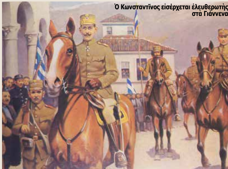
Ο Κωνσταντίνος εισέρχεται έλευθερωτής στα Γιάννενα

Τὴν ὕμνησαν πουλιὰ τῶν Γρεβενῶν, τῆς τραγουδῆσαν τὰ ἀηδόνια τοῦ Μετσόβου, νανοῦρισε γενιὲς παιδιῶν: «Κοιμήσου καὶ παρηγγεῖλα στὴν Πόλη τὰ προικιά σου/ στὰ Γιάννενα τὰ ρούχα σου καὶ τὰ χρυσαφικά σου».