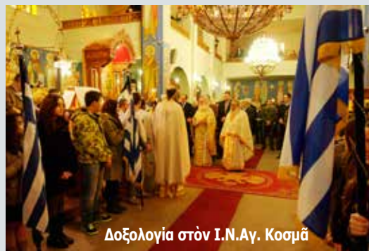
Δοξολογία στόν Ι.Ν.Αγ. Κοσμά