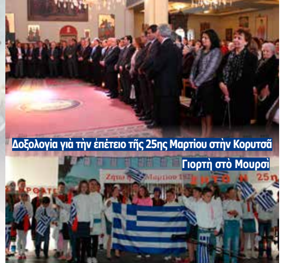
Δοξολογία για τήν επέτειο της 25ης Μαρτίου στην Κορυτσά