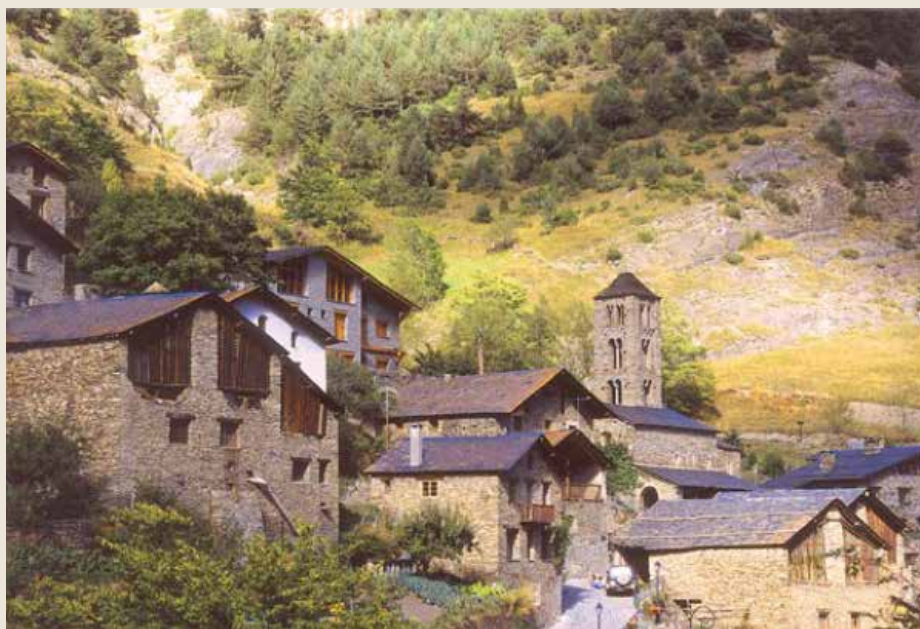
Τοπίο από το πλούσιο (!) κρατίδιο τής Ανδόρας. Η όμοιότητα με τα χωριά τής Βορείου Ηπείρου έκπληκτική!

στο άσπεϊο, ως θυμόμαστε ότι το κράτος του Κοσσόβου δημιουργήθηκε τη στιγμή που το ένα τρίτο του πληθυσμού είχε έγκαταλείψει τη λιμοκτονούσα Άλβανία, ανατρέποντας το «άπαρβιαστο» των συνόρων στην Εύρωπη.