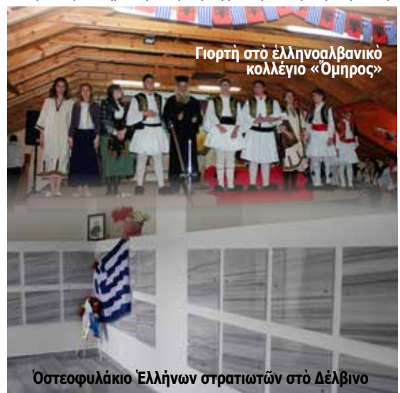
Όστεφυλάκιο Έλλήνων στρατιωτών στο Δέλβινο

Έπίσης, πολύ έντονη ήταν και ή παρουσία των βλαχόφωνων άδελφών μας. Η παρουσία αυτή έρχεται ως άπάντηση στις έντατικές προσπάθειες της Ρουμανίας για προσεταιρισμό τους. Η δραστηριότητα όμως της Ρουμανίας, άς παραδει-