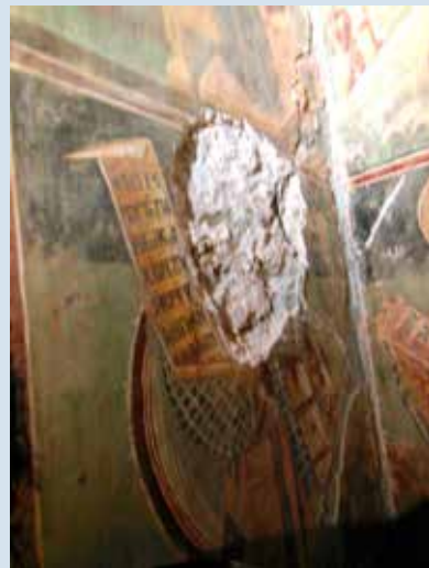
Κατεστραμμένη τοιχογραφία στο Έλβασάν

Στις άρχες του περασμένου Ιανουαρίου παρατηρήθηκε ή βίαιη άφαιρέση, με πρωτόγονα μέσα, τοιχογραφιών που χρονολογούνται από το 1554, του γνωστού άγιογράφου Όνουφριού. Ο βανδαλισμός σημειώθηκε στον Όρθόδοξο Ναό τής Αγίας Παρασκευής, στην περιοχή Γκίναρι του Έλβασάν.