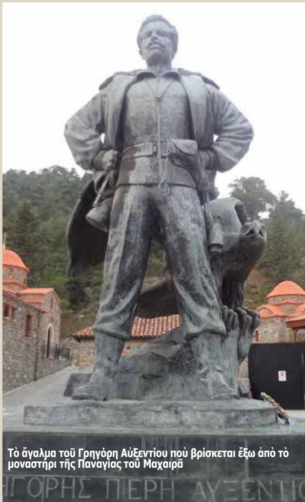
Τό άγαλμα του Γρηγόρη Αύξεντιού που βρίσκεται έξω από τó μοναστήρι τής Παναγίας του Μαχαιρά