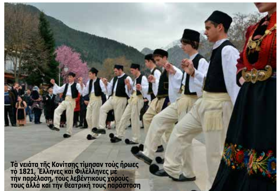
Τα νειάτα της Κονίτσας τίμησαν τους ήρωες τό 1821, Έλληνες και Φιλέλληνες με την παρέλαση, τους λεβεντικούς χορούς τους αλλά και την θεατρική τους παράσταση

(Κείμενο από την Έορτη του Γυμνασίου - Λυκείων της 25ης Μαρτίου 2013 στην Κόνιτσα)