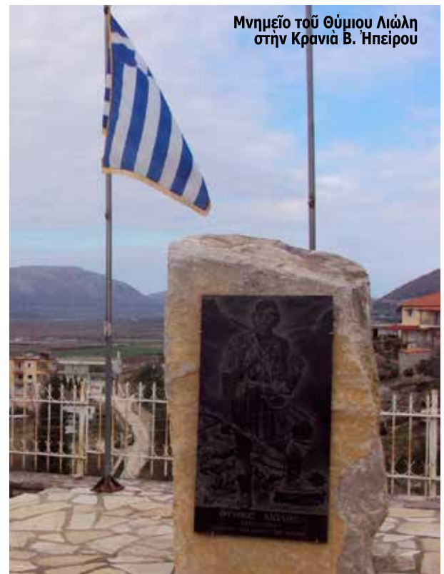
Μνημείο του Θύμιου Λιώλη στην Κρανιά Β. Ήπειρου

Θύμιο Λιώλης Όπλαρχηγός Βούρκου Β. Ήπειρου