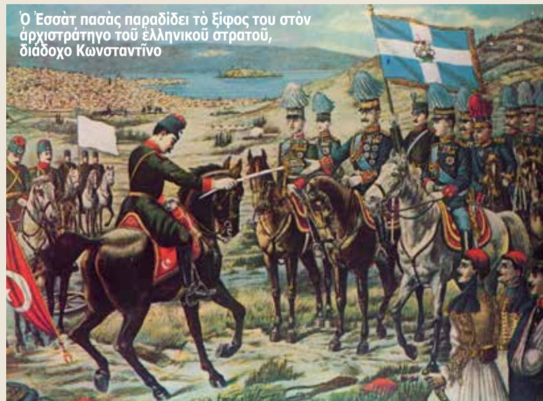
Ο Έσατ πασάς παραδίδει το ξίφος του στον αρχιστράτηγο του ελληνικού στρατού, διάδοχο Κωνσταντίνο