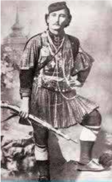
Ο όπλαρχηγός τής Βορείου Ήπειρου Θύμιος Λιώλης

Σήμερα, 21 Φεβρουαρίου 2013, που γιορτάζουμε την εκατοστή επέτειο των ΕΛΕΥΘΕΡΙΩΝ τής πόλης των Ίωαννίνων και του μεγαλύτερου τμήματος τής μεζονοβόρειου από τον όθωμανικό ζυγό πέντε αιώνων, θεώρησα πρέπον να μιλήσω δημόσια για τή λάθος απόφαση τής μητέρας πατρίδας σε βάρος του Βορειοηπειρωτικού Έλληνισμού κι απ’ ό τι έμαθα με προέκταση στον Έλληνισμό τής Πόλης, τής Τενέδου και τής Ίμβρου.