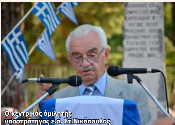
Ὁ κεντρικὸς ὁμιλητῆς ὑποστράτηγος ἐ.α. Στ. Νικόπουλος

Τὸν πανηγυρικό λόγο τῆς ἡμέρας ἐκφώνησε ὁ Ὑποστράτηγος ἐ.α. κ. Νικόπουλος Σταύρος τῆς Ε.Α.Α.Σ.