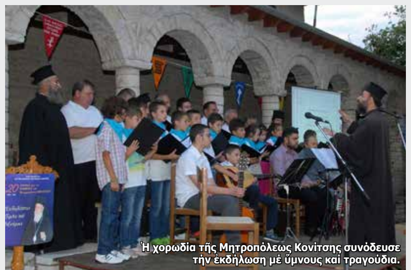
Ἡ χορωδία τῆς Μητροπόλεως Κονίτισης συνόδευσε τὴν ἐκδήλωση μὲ ὕμνους καὶ τραγούδια.

«...Ὁ Σεβαστιανὸς ἂν καὶ ἀπουσιάζει δὲν ἀπουσιάζει. Ἄν καὶ λείπει, δὲν λείπει. Καὶ αὐτὸ, διότι ἔκρυβε μέσα στὴν καρδιά του μεγαλεῖο,