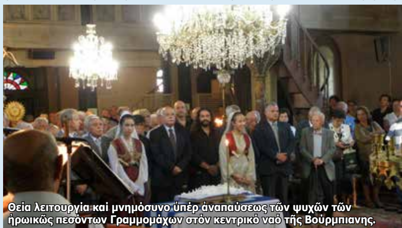
Θεῖα λειτουργία καὶ μνημόσυνο ὑπὲρ ἀναπαύσεως τῶν ψυχῶν τῶν ἡρωικῶς πεσόντων Γραμμομάχων σπὸν κεντρικὸ ναὸ τῆς Βούρμπιανης.

Καὶ ἀκόμη, ἀδελφοί, δέν διαμαρτυρηθήκαμε πού κάποια κυβέρνηση ἔδωσε συντάξεις στοὺς κατσαπλιάδες, ὅταν γύρισαν ἐξαθλιωμένοι ἀπὸ τὶς χώρες τῆς Ἀνατολικῆς Εὐρώπης καὶ δέν δίνει ἡ Πολιτεία καὶ σήμερα ἀκόμη, τὴν μικρὴ σύνταξη τοῦ ΟΓΑ στοὺς ἠλικιωμένους Βορειοηπειρώτες, πού ἔζησαν στὸ πετσί τους τὴν κομμουνιστικὴ τυραννία τοῦ Ἐνβέρ Χότζα, διότι ἐξακολουθοῦν νὰ παραμένουν στὴ γῆ τῶν πατέρων τους. Καὶ τί ζητᾶει ἡ Ἑλλάδα ; Ζητᾶει οἱ γέροντες Βορειοηπειρώτες νὰ ἐγκατασταθοῦν ἐδῶ, μόνιμα. Καὶ ἐκεῖ τί θὰ γίνει ; Ἄν φύγουν καὶ αὐτοὶ οἱ λίγοι πού ἔχουν μείνει καὶ πού κρατᾶνε τὰ σπίτια τους καὶ τὰ χωριά τους ἀνοικτὰ, θὰ ἐρημώσῃ ἡ Βόρειος Ἠπειρος καὶ οἱ Ἀλβανοὶ θὰ χειροκροτοῦν καὶ θὰ λένε « - Μπράβο στὴν Ἑλλάδα, τώρα δέν ὑπάρχει Βόρειος Ἠπειρος». Ἔ, λοιπόν, ἐμεῖς τοὺς λέμε: Ὑπάρχει Βόρειος Ἠπειρος καὶ θὰ ζήσει ἡ Βόρειος Ἠπειρος! Ἄν, ὅμως, φύγουν, ὅπως ἐπιδιώκει κάκιστα ἡ ἑλληνικὴ πολιτεία, τότε θὰ μπεῖ ταφόπλακα στὸ Βορειοηπει-