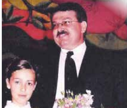
ΓΡΗΓΟΡΗΣ ΝΤΡΙΓΚΟΓΙΑΣ: ΑΠΩΝ-ΠΑΡΩΝ Σελ. 1