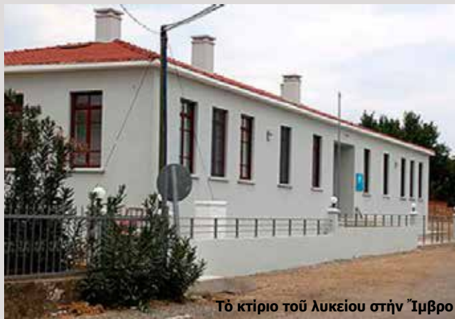
Τό κτίριο του λυκείου στην Ίμβρο