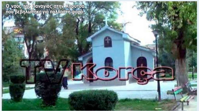
Ο ναός τής Παναγίας στην Κορυτσά που βεβηλώθηκε για πολλοστή φορά.

και στο έσωτερικό του ναού άλλά και τό γεγονός πώς άφού άφαιρέσαν κάθε κάγκελο και μπορούσαν να μπουν από τήν πόρτα επέλεξαν τό παράθυρο άπλώς έπιβεβαιώνει τις ύποπιές μας πώς πρόκειται για βεβήλωση που είχε στόχο τήν τρομοκράτηση των όρθόδοξων και ως κίνητρο τό θρησκευτικό μίσος. Οί βάνδαλοι είχαν τήν άνεση και τόν χρόνο να καταστρέφουν ό,τι θέλουν μέσα στο ναό, άνενόχλητοι. Ο ναός τής Παναγίας καταστράφηκε από τόν Χότζα και τώρα αυτό που υπάρχει είναι μόνο ένα παρεκκλήσι. Φυσικά οι όρθόδοξοι ναοί βρίσκονται στο έλεος των έξτρεμιστικών στοιχείων.