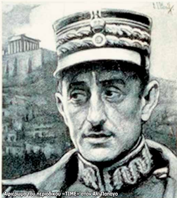
Άφιέρωμα του περιοδικού «TIME» στον Αλ. Παπάγο

πλειόστον αξιωματικοί. Η αποκάλυψη της δράσης τους τον Ιούλιο του 1943 συνοδεύτηκε από την σύλληψη και την αποστολή του, μαζί με άλλους τέσσερις αντιστρατήγους, σε στρατόπεδα συγκέντρωσης (στο Νταχάου, μεταξύ άλλων), στα όποια παρέμεινε μέχρι τη συνθηκολόγηση της Γερμανίας. Επέστρεψε μετά τον Πόλεμο στην Ελλάδα μαζί με τους άλλους 4 αντιστρατήγους με τους οποίους ήταν εγκλειστος των Γερμανών. Αποστρατεύτηκε με τον βαθμό του Στρατηγού.