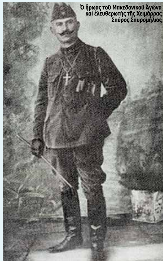
Ο ήρωας του Μακεδονικού Αγώνα και έλευθερωτής τής Χειμάρρας Σπύρος Σπυρομήλιος

(Τό μεγαλύτερο μέρος του κειμένου είναι άπόσπασμα από τό προσφάτως έκδοθέν βιβλίο υπό τόν τίτλο «Η ιστορία του Έλληνικού Στρατού, 1833 – 1949», Αθήνα : έκδόσεις Σάκκουλα, 2014)