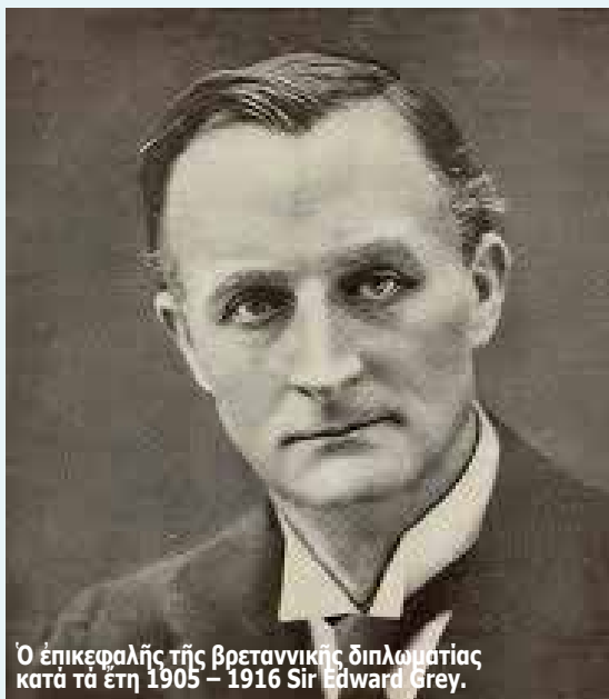
Ο επικεφαλής της βρετανικής διπλωματίας κατά τα έτη 1905 – 1916 Sir Edward Grey.

Ίωάννης Σ. Παπαφλωράτος Νομικός - Διεθνολόγος Διδάκτωρ Πανεπιστημίου Αθηνών