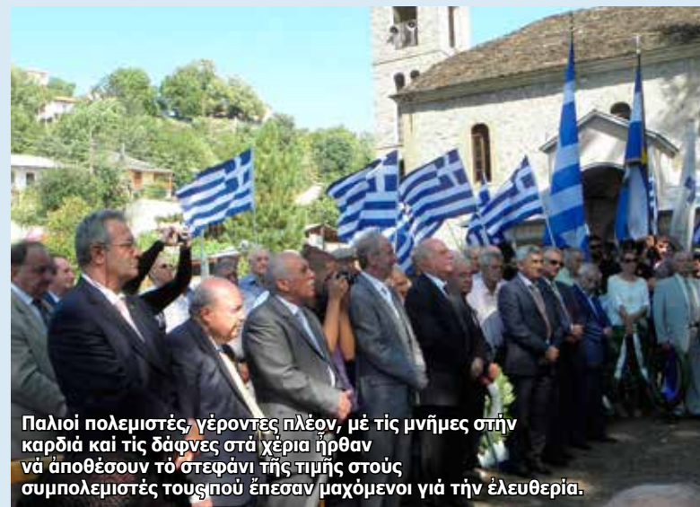
Παλιὸι πολεμιστῆς, γέροντες πλέον, με τὶς μνήμες στὴν καρδιά καὶ τὶς δάφνες στὰ χέρια ἦρθαν νὰ ἀποθέσουν τὸ στεφάνι τῆς τιμῆς στοὺς συμπολεμιστῆς τοῦσιπὺ ἐπέσαν μαχόμενοι γιὰ τὴν ἐλευθερία.

ἔλεγε καὶ τὴν ὁποία σᾶς μεταφέρω σήμερα : «Ἀδελφοὶ Ἕλληνες, μᾶς ξεχάσατε. Λησμονήσατε τὸν τιτάνιο ἀγῶνα καὶ τὴ θυσία μας γιὰ νὰ μείνει ἡ Ἑλλάδα ἐλεύθερη, ἔξω