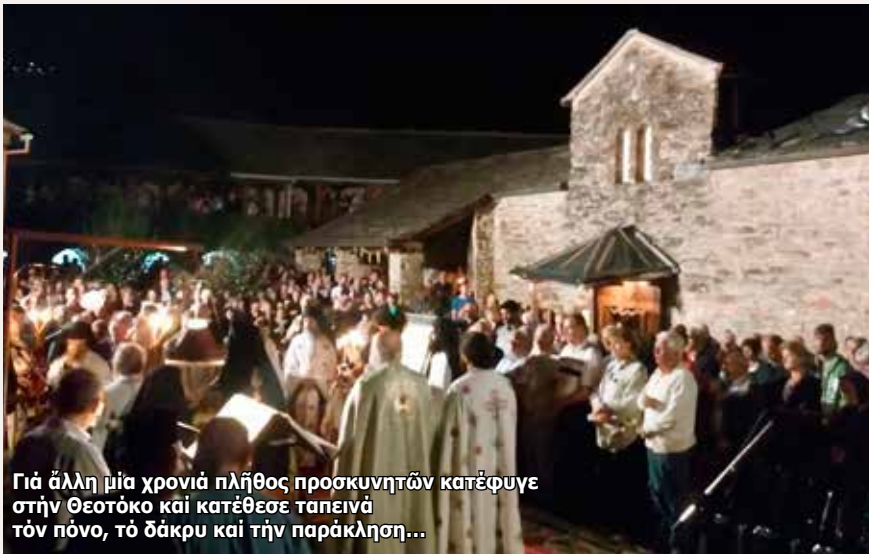
Γιά άλλη μία χρονιά πλήθος προσκυνητών κατέφυγε στην Θεοτόκο και κατέθεσε ταπεινά τον πόνο, τό δάκρυ και την παράκληση...

Όπως κάθε χρόνο, έτσι και φέτος, στην Ί. Μονή Μολυβδοσκεπάστου Κονίτσης εορτάστηκε λαμπρώς η Κοίμηση τής Θεοτόκου, αφού εκεί είναι θησαυρισμένη ή ιερά και θαυματουργή Εικόνα τής Θεομήτορος. Τήν παραμονή τελέσθηκε ιερά Αγρυπνία στον προαύλιο χώρο τής Μονής από τις 9μ.μ. έως τις 5.30 τα ξημερώματα, και τήν κυριώνυμη ημέρα πραγματοποιήθηκε νέα Θεία Λειτουργία στο «καθολικό» τής Μονής. Κατά τον πανηγυρικό Έσπερινό, που πλήθος κόσμου είχε κατακλύσει τόν αυλειό χώρο τής Ί. Μονής, ο Μητροπολίτης Δρυϊνουπόλεως, Πωγωνιανής και Κονίτσης κ.κ. Ανδρέας όμιλησε άρχικά για τό πρόσωπο τής Παναγίας μας, δίνοντας κάποιες δογματικές διευκρινήσεις, αντιδιαστέλλοντάς τες με τά πιστεύω άλλων χριστιανικών όμολογιών. Στη συνέχεια τόνισε τά ακόλουθα: ΜΟΝΗ ΜΟΛΥΒΔΟΣΚΕΠΑΣΤΟΥ ΚΑΙ ΜΗΤΡΟΠΟΛΙΤΗΣ ΣΕΒΑΣΤΙΑΝΟΣ