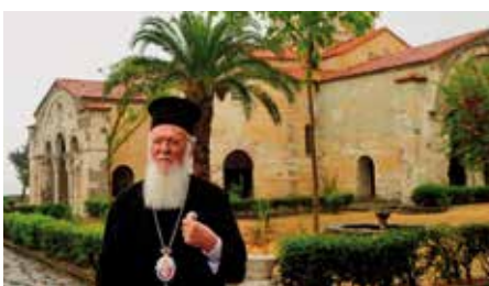
Ο Οικουμενικός Πατριάρχης κ.κ. Βαρθολομαίος μπροστά από τον Ι.Ν. Αγίας Σοφίας στην Τραπεζούντα.

της στους πιστούς μουσουλμάνους που θα προσευχηθούν». Αποκάλυψε δε πως ήδη η Διεύθυνση Θρησκευτικών Υποθέσεων της Τουρκίας έχει ορίσει ιμάμηδες για τον συγκεκριμένο χώρο. Ακόμη ο μουφτής δήλωσε προκλητικά, ότι «τις ώρες της