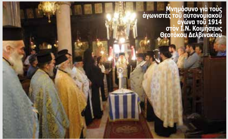
Μνημόσυνο για τους αγωνιστές του αυτόνομιακού αγώνα του 1914 στον Ι.Ν. Κοιμήσεως Θεοτόκου Δελβινακίου

κατ' όνομα, άλβανοψύχων όμως στην πραγματικότητα. Στις άρχές τής δεκαετίας του 1990 το άλβανικό κομμουνιστικό καθεστώς, ακολουθώντας την πορεία των καθεστώτων τής ανατολικής Ευρώπης, γκρεμίστηκε και μαζί του ή βία και ή τυραννία. Με πρωτοβουλία του Οικουμενικού Πατριάρχου ή Έκκλησία ξανασυστάθηκε, με επί κεφαλής τον Μακαριώτατο Αρχιεπίσκοπο κύριο Άναστάσιο. Στά κατοπινά χρόνια θα ίδρυθῆ ή «ΟΜΟΝΟΙΑ», θα γίνῆ ή σπληνική δίκη των πέντε (5) έκλεκτών και δραστήριων μελών τής, ενώ ένα σημαντικό μέρος των Βορειοηπειρωτών θα εγκατασταθῆ στην Ελλάδα, ζητώντας μια καλύτερη τύχη για τους ίδιους και για τα παιδιά τους.