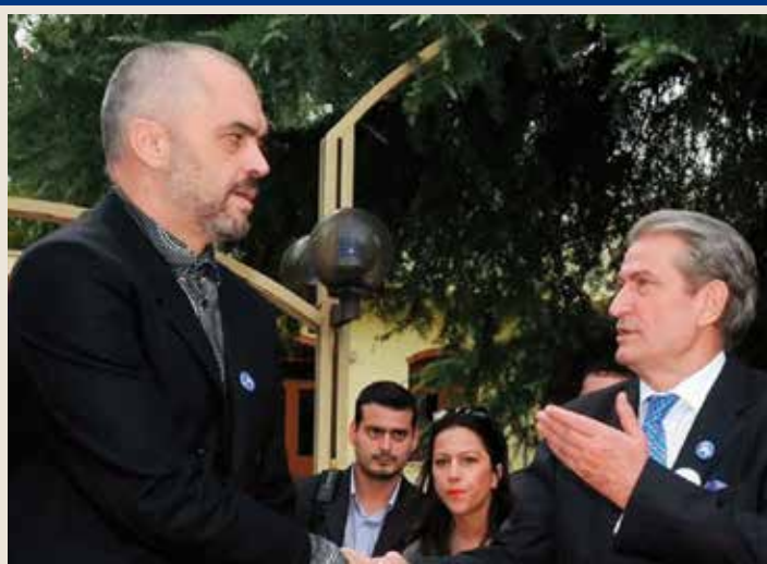
Ὁ Ἐντι Ράμα (ἀριστερά) καὶ ὁ Σαλί Μπερίσα (δεξιὰ) ἀναμετρήθηκαν στὶς πρόσφατες Ἀλβανικὲς ἐκλογές. Ἡ συμμαχία τοῦ Σοσιαλιστικοῦ Κόμματος (Ράμα) ἔλαβε 57,7% καὶ 84 ἀπὸ τὶς 140 ἔδρες ἐνῶ ἡ συμμαχία τοῦ Δημοκρατικοῦ Κόμματος (Μπερίσα) ἔλαβε 39,4% καὶ 56 ἔδρες.

αὐτὲς -ποὺ θὰ εἶναι καὶ ὁ ρυθμιστὴς τῶν ἐξελίξεων- εἶναι τὸ κόμμα τοῦ Ἰλίρ Μετα ὅπου οἱ ψηφοφόροι πλαισιώθηκαν πιὸ πολὺ ἀπὸ τὴ δικὴ του προσωπικότητα, (σὲ ἀντίθεση μὲ τὴν νευρικότητα καὶ σὲ πολλὲς περιπτώσεις νευρασθένεια τοῦ Ράμα) παρὰ ἀπὸ τὸ ὄνομα τοῦ κόμματος.