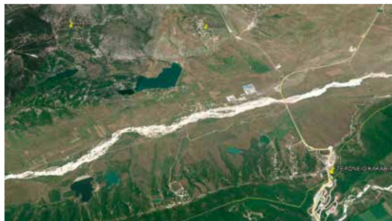
Μέρος τής έπαρχίας Δρόπολης Βορείου Ήπείρου. Σημειώνονται μέ κίτρινο τά χωριά Πέπελη και Βοδίνο και τó τελωνείο τής Κακαβιάς. Η έντονη άσπρη γραμμή είναι ό παταμός Δρινος.

Τό 1955 σε ήλικία 85 έτών τόν άξιωσε ό Θεός νά προγνώρισει τó τέλος τού άδελφου του που μόναζε στο Άγιον Όρος και παρά τήν ήλικία του έκανε τó ταξίδι και πρόλαβε ζωντανό τόν άδελφό του, ό όποιος κοιμήθηκε στήν άγκαλιά του. Άφοϋ τόν έθαψε εκεί επέστρεψε στο μοναστήρι του. Τήν ίδια χρονιά πήγε για έξομολόγηση στήν Κωνσταντινούπολη τήν περίοδο τής Μεγάλης Τεσσαρακοστής και έγινε δεκτός μέ πολλή άγάπη και σεβασμό από τούς Έλληνες τής Πόλης. Παρά τó γεγονός ότι πέρασε από πολλά βάσανα και κακουχίες και παρά τά προβλήματα ύγείας που άντιμετώπιζε συχνά, έζησε μέχρι τά 90 του χρόνια. Κοιμήθηκε μέ όσιακό τρόπο, στο νοσοκομείο τών Ίωαννίνων, στις 15 Φεβρουαρίου τού 1960, διατηρώντας μέ