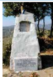
Τό λιτό μνημείο για τους Έλληνες ήρωες του 1940 στο ύψωμα 731 πριν καταστραφεί από τους βανδάλους.