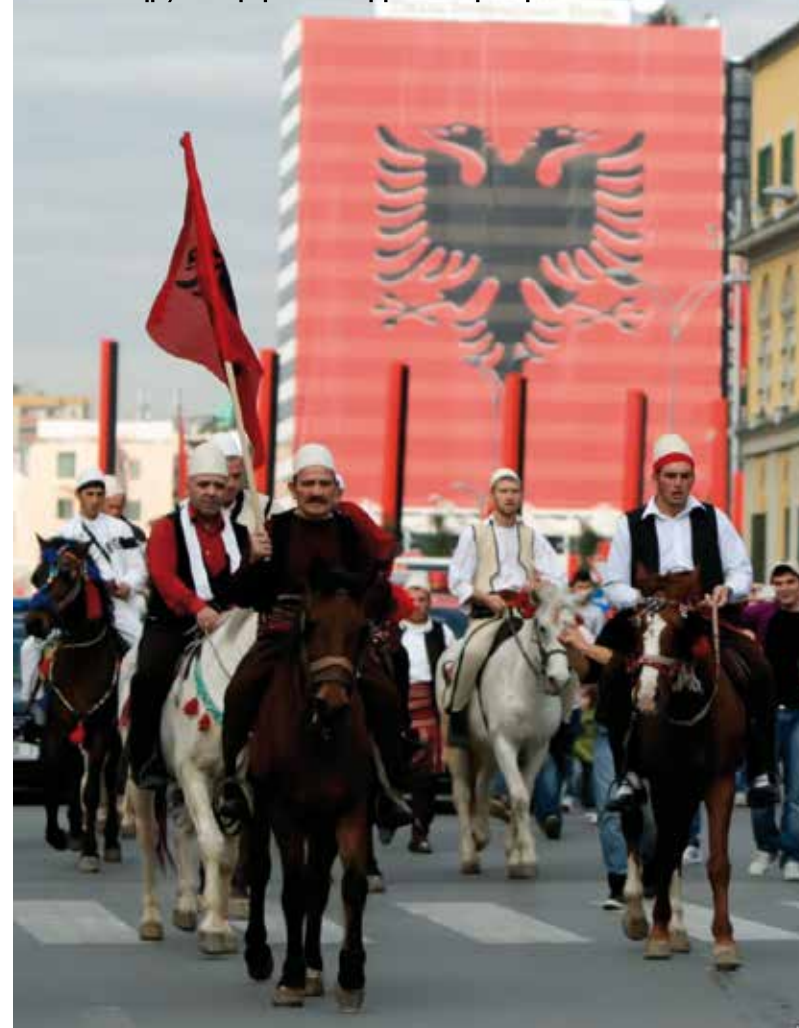
Έφιπποι Άλβανοί από τό Κόσοβο περνούν στους δρόμους των Τιράνων με φόντο τήν Άλβανική σημαία, τήν βυζαντινή δηλαδή πολεμική σημαία με τον δικέφαλο άετό πού ύπήρξε τό λάβαρο του Γεωργίου Καστριώτη!

Γεώργιος Διον. Κουρκούτας Καθηγητής Φιλόλογος Πανελλήνιος Σύνδεσμος Βορειοηπειρωτικού Άγώνος (ΠΑ.ΣΥ.Β.Α.) Παράρτημα Πύργου Ήλειας