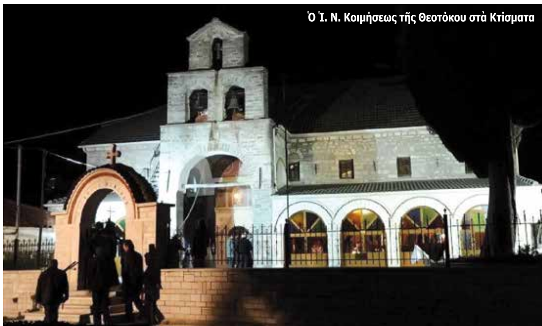
Ο Ί. Ν. Κοιμήσεως τής Θεοτόκου στα Κτίσματα

(Λόγος του Μητροπολίτου κατά την Έξοδίο Ακολουθία, έξ αφορμής του φρικαλέου έγκλήματος από Άλβανό σε δύο ηλικιωμένους τών Κτισμάτων Πωγωνίου Ν. Ίωαννίνων στις 13.5.2013)