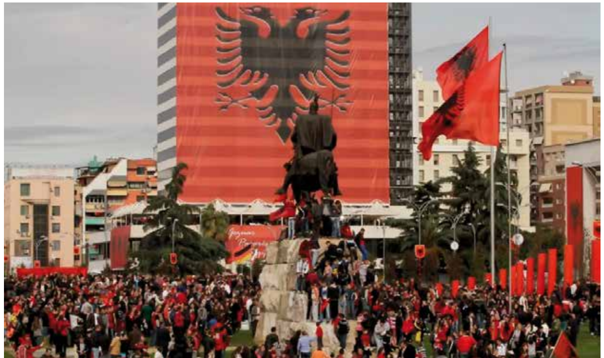
Πλήθος κόσμου προσήλθε στην κεντρική πλατεία των Τυράνων για να γιορτάσει τά 100 χρόνια άνεξαρτησίας τής Άλβανία υπό τή σκία του άγάλματος του Σκεντέρμπεη!!!!... του Έλληνα δηλαδή πρίγκιπα (Γ. Καστριώτη) που οι Άλβανοί τιμούν ως έθνικό ήρωα!

4. Μεγάλο θέμα άποτελεί ό Πόλεμος έναντίον τής Όρθοδοξίας στην Άλβανία και την Βόρειο Ήπειρο. Από την δεκαετία του 1920 και με δεδομένο ότι ή πλειοψηφία των Άλβανών ήσαν και είναι Μουσουλμάνοι, ή έπίσημη Άλβανία θέλησε να έξοβελίσει την όρθοδοξία από τό κέντρο τής ζωής τής Χώρας. Αυτό συνετελέσθη με την άπομάκρυνση από τό Οικουμενικό Πατριαρχείο (Σχίσμα), τόν διωγμό των Ίεραρχών και ιερέων που άκολουθούσαν τό Φανάρι και την άπαγόρευση τής Έλληνικής Γλώσσας από τις έκδηλώσεις Λατρείας. Πόλεμος έξελίχθηκε για χρόνια κατά τής Όρθοδοξίας (που μία μορφή του φτάνει ως και τά σημερινά έμπόδια που συναντά την τελευταία εικοσαετία ό Αρχιεπίσκοπος Αναστάσιος και ή προσπάθειά του να άνασυγκροτήσει την Όρθόδοξη Έκκλησία μετά από τις δεκαετίες φρικτών διωγμών από τό Κομμουνιστικό καθεστώς Χότζα). Αμέτρητοι Ναοί έκλεισαν ή έγιναν από άποθήκες ως ...πολιτι-