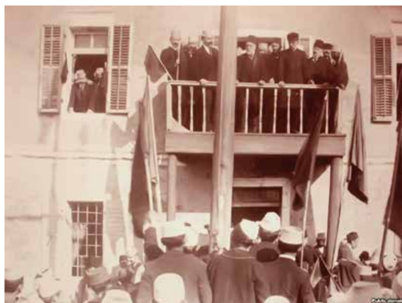
Ό Ήγέτης των Άλβανών Ismail Qemali (κέντρο) άνακοινώνει τή διακήρυξη τής ανεξαρτησίας τής Άλβανίας μετά τή συνέλευση του Αύλωνα στις 28 Νοεμβρίου 1912.

8. Η ύποστήριξη του Άλβανικού Κράτους στην κομμουνιστική Άνταρσία στην Ελλάδα. Στα δύσκολα για τήν Ελλάδα μεταπολεμικά χρόνια, ή Άλβανία υπό τον Έμβέρ Χότζα βρέθηκε (ως τον θάνατο του Στάλιν) στο Σοβιετικό Κομμουνιστικό στρατόπεδο. Από τήν θέση αούτη προσέφερε τό έδαφος της στους Κομμουνιστές άντάρτες τής περιόδου 1946-1949 πού με τήν καθοδήγηση του Νίκου Ζαχαριάδη έκαναν Πόλεμο έναντιον του Έλληνικού Κράτους. Οί Κομμουνιστές άντάρτες με όρμητήριο τήν Άλβανία έπιτίθονταν στα Έλληνικά χωριά τής μεθορίου σε Ήπειρο και