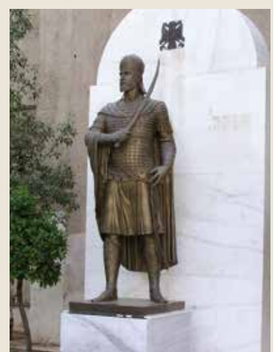
Κωνσταντίνος ΙΑ' Παλαιολόγος.

Ός άπλός στρατιώτης ο Κωνσταντίνος ΙΑ' πολεμά στην πύλη του Άγίου Ρωμανού. Πριν πέσει σκορπίζει με τό σπαθί του τό θάνατο σε όσους Τούρκους άντιμετωπίζει.