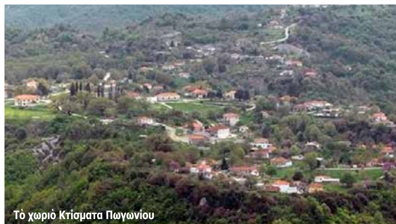
Τὸ χωριὸ Κτίσματα Πωγωνίου