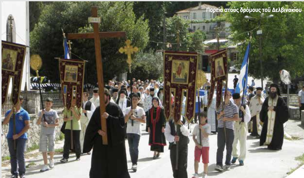
Πορεία στους δρόμους του Δελβινακίου