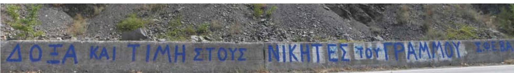
Η Σ.Φ.Ε.Β.Α. τίμησε μέ τόν δικὸ της τρόπο τὰ παλικάρια πού θυσιάστηκαν γιά νά μὴν γίνει ἡ Ἑλλάδα μας ... Ἀλβανία

Ἐγὼ δέ προσωπικῶς, βεβαιώνω καί κείνους, τοὺς ἥρωες, καί σᾶς, πού εἶστε ἐδῶ, ὅτι ὅσο μπορῶ θά προσπαθῶ νά μένω πιστὸς στίς πολυτίμες ὑποθήκες τοῦ σεπτοῦ Προκατόχου μου, τοῦ μεγάλου καί ὄντως Ἁγίου Μητροπολίτου ΣΕΒΑΣΤΙΑΝΟΥ, νά ἀγαπῶ, δηλαδή, τὸν Χριστὸ καί τήν Ἑλλάδα. Καί σεῖς, αγαπητοί ἀδελφοί, νά ἀγαπᾶτε τὸν Χριστὸ καί τήν Ἑλλάδα, ὡστε νά συναντώμεθα ἐδῶ, στέλνοντας παντοῦ τὸ μήνυμα: Ζήτω ὁ Γράμμος. Ζήτω ἡ Ἑλλάδα μας. Ὁ Χριστὸς μαζί σας. ΑΜΗΝ.