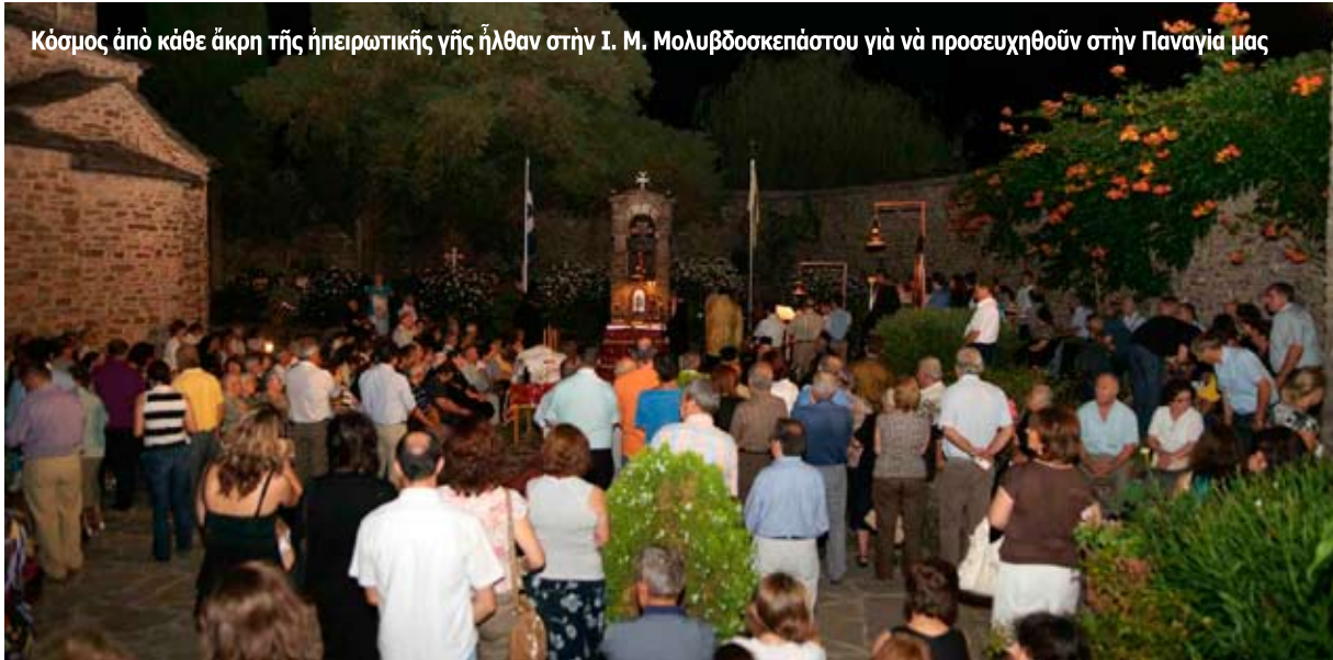
Κόσμος ἀπὸ κάθε ἄκρη τῆς ἠπειρωτικῆς γῆς ἦλθαν στὴν Ι. Μ. Μολυβδοσκεπάστου γιὰ νὰ προσευχηθοῦν στὴν Παναγία μας

Τὰ βασικότερα σημεία τῆς ΟΜΙΛΙΑΣ τοῦ Σεβασμ. Μητροπολίτου Δρυϊνουπόλεως κ. Ανδρέου στὴν Ἀγρυπνία τῆς Μολυβδοσκεπάστης (14.8.2011)