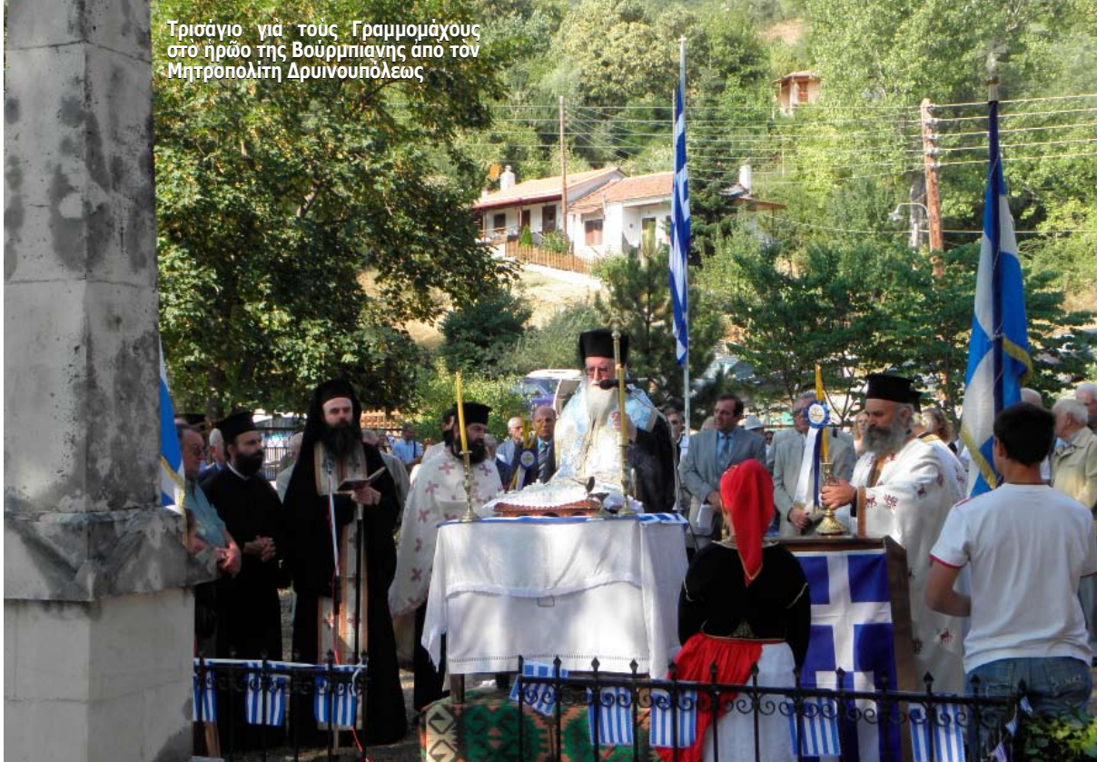
Τρισάγιο για τους Γραμμομάχους στο ηρώο της Βούρμπιανης από τον Μητροπολίτη Δρυϊνουπόλεως

“Εκλείσει τὸ λόγο του με τὰ ἐξῆς: “Ἡ ἐθνική συμφιλίωση δὲν μπορεῖ νὰ στηριχθεῖ πάνω σὲ ἱστορικές ἀνακρίβειες, οὔτε νὰ ἐπιτευχθεῖ με μονομερείς παραχωρήσεις ἀπὸ τὴ μία πλευρὰ” Τέλος στὴ ὁμιλία του ὁ Μητροπολίτης Κονίτσας κ. .κ. ΑΝΔΡΕΑΣ, ἐμψύχωσε καὶ ἀναπτέρωσε τὸ ἠθικὸ τῶν προσκυνητῶν με ἓνα πύρινο λόγο. Ἐξῆρε τὴ θυσία τῶν στρατευμένων παιδιῶν τῆς ἐποχῆς. Σηλίτευσε τὴ νέα φορολογική ἐπιδρομὴ ἐνῶ κατηγορήσε δριμύτατα τὸν πρωθυπουργὸ γιὰ τὴν ἀποποινικοποίηση τοῦ χασίς. Ἀναφερόμενος στὸν