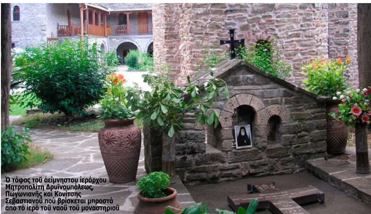
Ο τάφος του άειμνηστου ιεράρχου Μητροπολίτη Δρυϊνουπόλεως, Πωγωνιανής και Κονίτσης Σεβαστιανού που βρίσκεται μπροστά από το ιερό του ναού του μοναστηριού