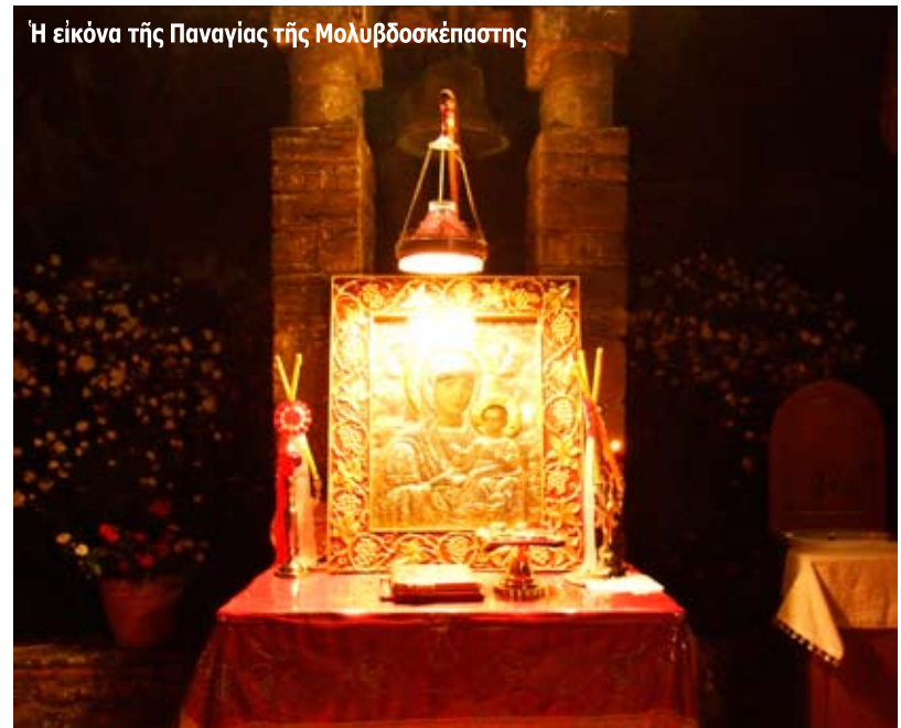
Ἡ εἰκόνα τῆς Παναγίας τῆς Μολυβδοσκεπάστης