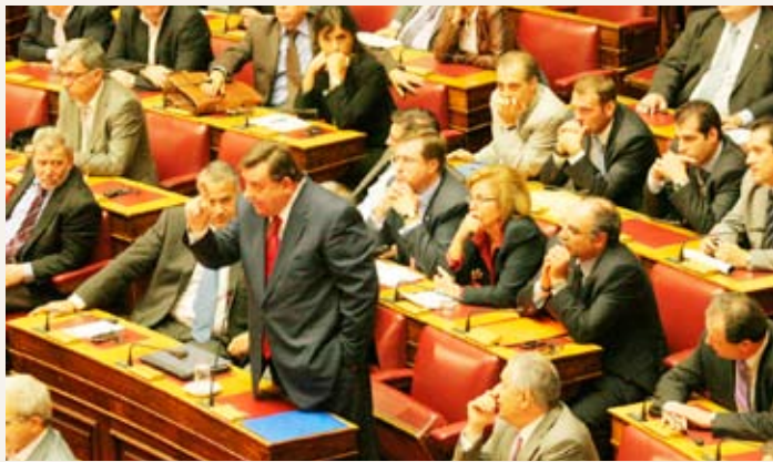
Η κοινοβουλευτική ομάδα του ΛΑ.Ο.Σ.

α) Πώς προτίθεθε να κινήθει, βάσει του άκόμα ενεργού «Πρωτοκόλλου τής Κέρκυρας», για τήν δικαίωση κατοχυρωμένων, συμβατικώς και αίματηρώς, δικαιωμάτων του Βορειοηπειρωτικού Έλληνισμού;