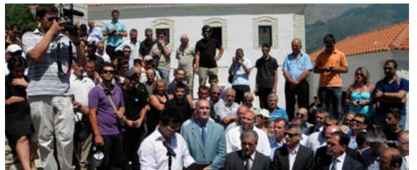
Πλήθος κόσμου τίμησε με τὴν παρουσία του τὸν ήρωα. Πίσω διακρίνεται τὸ δημοτικὸ σχολεῖο Χειμάρρας.