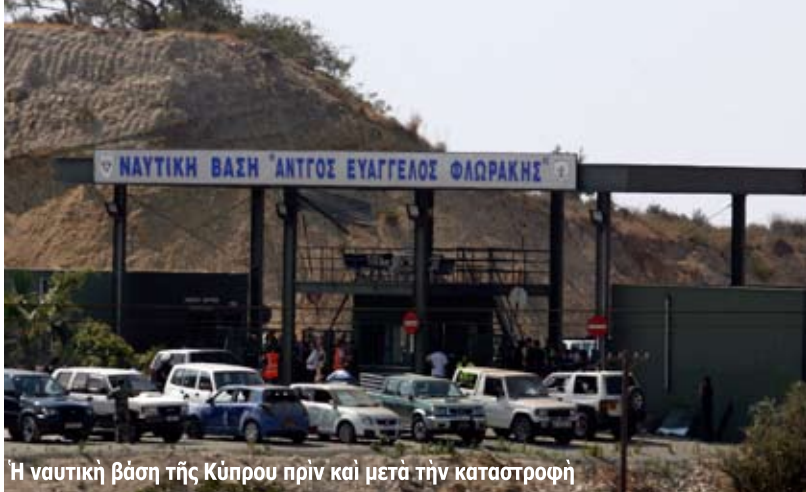
Η ναυτική βάση της Κύπρου πριν και μετά την καταστροφή

Το πρωί της 11ης Ιουλίου 2011, στην ναυτική βάση «Ευάγγελος Φλωράκης» της Εθνικής Φρουράς κοντά στην Λεμεσό, σημειώθηκε φονική έκρηξη. Τόνοι έκρηκτικών υλών, που βρισκότουσαν χωρίς καμιά προφύλαξη στον προαύλιο χώρο της ναυτικής βάσεως, εξερράγησαν - πιθανότατα λόγω των υψηλών θερμοκρασιών - προκαλώντας φοβερές καταστροφές σε