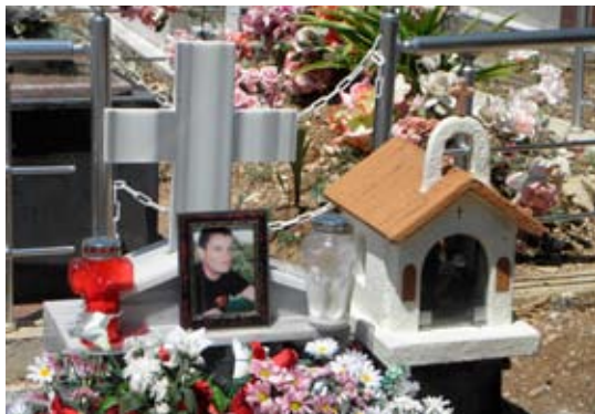
Ο τάφος του Άρ. Γκούμα