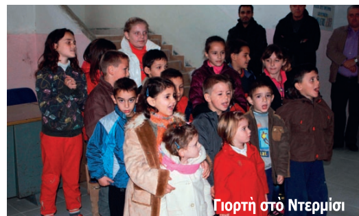
Γιορτή στο Ντερμισί