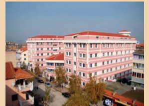
Τὸ μουσουλμανικὸ λυκεῖο Κορυτσᾶς