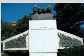
Τὸ μνημεῖο τῶν 4 παλληκαριῶν στὸ Ἄλυκο

(Τὸ Ἄλυκο, καταλύτης τῆς πτώσης τοῦ κομμουνισμοῦ στὴν Ἀλβανία καὶ τοῦ ἐκδημοκρατισμοῦ τῆς Χώρας).