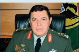
Ο στρατηγός Φράγκος Φραγκούλης

Ο πρ. Αρχηγός του Γ.Ε.Σ. στρατηγός κ. Φραγκούλης Φράγκος, στα τέλη του περασμένου Οκτωβρίου παρουσίασε το βιβλίο του «Ποιά Τουρκία; Ποιοί Τούρκοι;». Με άφορμή δε την υποθήση του Πομάκου ιμάμη στην Θράκη, ο οποίος δημοσιοποίησε τις εναντίον του απειλές και τους έκβιασμούς από το τουρκικό προξενείο Κομοτηνής, ο στρατηγός κ. Φράγκος έκανε την ακόλουθη πρόταση, που προκάλεσε το πιό παρατεταμένο χειροκρότημα: «Η Ελλάδα, είπε ο στρατηγός, να ανοίξει προξενείο στον Πόντο, στην Τραπεζούντα».