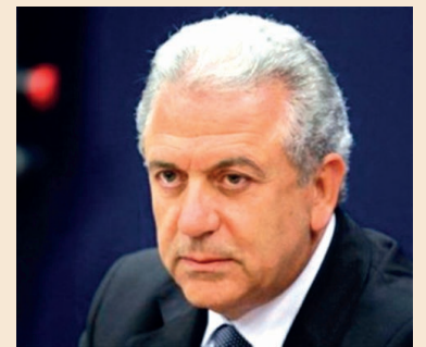
Ο υπουργός εξωτερικών Δ. Αβραμόπουλος