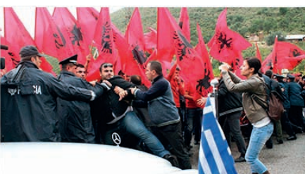
Αλβανοί έθνικιστές στην Κλεισούρα δημιουργούν έπεισόδια καθώς περνάει το αυτοκίνητο του Έλληνα πρέσβη

Τά επεισόδια στην Κλεισούρα κατά του Έλληνα πρέσβη και μελών της έπίσημης αποστολής, που μετέβησαν εκεί προκειμένου να παραστούν στις έκδηλώσεις τιμής για τους πεσόντες του 1940, και για τα όποια γράφουμε στο προηγούμενο σχολίο μας, καταδίκασε το Έλληνικό Υπουργείο Έξωτερικών.