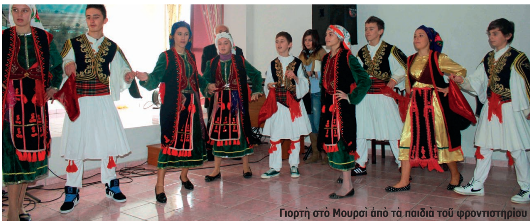
Γιορτή στο Μουρσί από τα παιδιά του φροντιστηρίου

Άπό τήν πλευρά μας και στις συναντήσεις με τούς δασκάλους τών φροντιστηρίων τής περιοχής, τούς διαβεβαίωσαμε ότι παρά τή δύσκολη συγκυρία που περνάει ή πατρίδα μας θά είμαστε πάντα δίπλα σε όσους αγωνίζονται με όπλο τήν ελληνική παιδεία και τόν πολιτισμό για να μείνουν ελληνικά τα άγιασμένα χώματα τής Βορείου Ήπειρου.