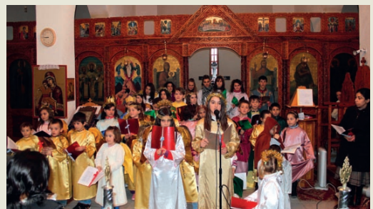
Χριστουγεννιάτικη γιορτή από τά παιδιά του φροντιστηρίου στην Πολένα Κορυτσάς