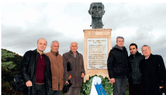
Μέλη και φίλοι τής ΣΦΕΒΑ στην προτομή του ήρωα δασκάλου Φίλιππα Παπαθανάση που μαρτύρησε στις φυλακές τής Αλβανίας.

Και αυτά τὰ Χριστούγεννα μέλη του ΠΑΣΥΒΑ και τής ΣΦΕΒΑ βρεθήκαμε κοντά στους δασκάλους και στους μαθητές τών φροντιστηρίων ελληνικής γλώσσας στη Βόρειο Ήπειρο.