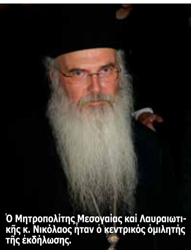
Ο Μητροπολίτης Μεσογαίας και Λαυραιωτικής κ. Νικόλαος ήταν ο κεντρικός όμιλητής τής έκδήλωσης.

20 ολόκληρα χρόνια από τήν κοιμησή του. Περισσότερα από 90 από τή γέννησή του. Άπειρα και αιώνια τὰ χρόνια τής ζωής του. Μάς λείπει ή φωνή και ή εικόνα του, τὸ πρότυπο και ή ζωντάνια του, ο λόγος και ή μαρτυρία του. Μάς παρηγορεί ή μνήμη