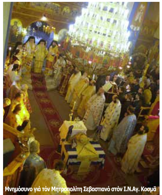
Μνημόσυνο για τόν Μητροπολίτη Σεβαστιανό στόν Ί.Ν.Αγ. Κοσμά

Η άλήθεια είναι ότι άντέδρασε σε αυτή τήν άπόφαση όσο έλάχιστοι. Ίσως από ταπεινώση και άρνηση του αξιώματος, ίσως από άνάγκη να συνεχίσει τήν ήδη μεσουρανούσα άποστολή του, ίσως από άγάπη στους ανθρώπους στους οποίους προσφέρθηκε ολόκληρος, ίσως από τήν ύποψία ότι πιθανόν αυτή ή έκλογή να έκρυβε τήν πονηρή σκοπιμότητα μιός μεθοδευμένης έξορίας και διαγραφής του από τὸ προσκήνιο τής ζωής διακονίας. Πάντως άντέδρασε, εύγενώς αλλά σταθερά άρνήθηκε, παρακάλεσε για άνάκληση τής άποφάσεως, δεν βιάστηκε να συμβιβαστεί και να ύποχωρήσει. Του ζητήθηκε ύπακοή στην Εκκλησία και ύποχώρησε. Εύτυχώς που έκανε τὸ λάθος! Συνήθως τὸ θέλημα του Θεού είναι τὸ αντίθετο από τὸ δικό μας. Σύντομα τόν συναντούμε στα χωριά τής Κονίτσης. Παντού