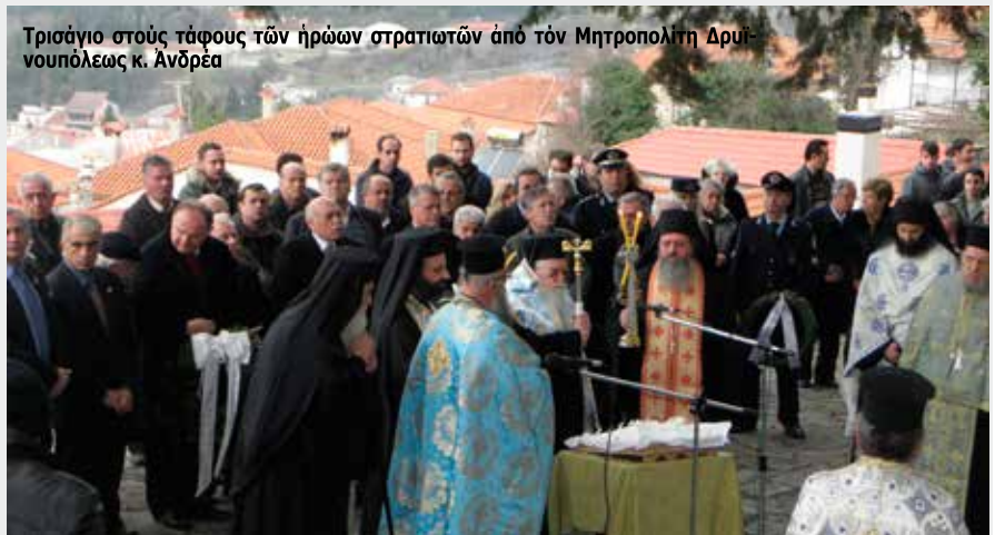
Τρισάγιο στοὺς τάφους τῶν ἡρώων στρατιωτῶν ἀπὸ τὸν Μητροπολιτὴ Δρυϊνουπόλεως κ. Ἀνδρέα

Τὰ πράγματα, λοιπὸν, δείχνουν, ὅτι ὁ Κομμουνισμὸς τώρα, παίρνει τὴν «ρεβάν», μετὰ τὴν ἴπτα του ἐδῶ στὴ μάχη τῆς Κονίτσης, καὶ ἀργότερα βεβαίως, στὸ Βίτσι καὶ στὸ Γράμμο. Καὶ λένε ἀκόμη τὰ πράγματα ὅτι «ἐσχάτη ὥρα ἐστὶ». «Τὸ μαχαίρι ἔχει φθάσει πλέον στὸ κόκκα-