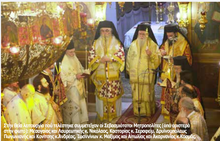
Στην θεία λειτουργία που τελέστηκε συμμετείχαν οι Σεβασμιότατοι Μητροπολίτες (από αριστερά στην φωτο): Μεσογαίας και Λαυρεωτικής κ. Νικόλαος, Καστορίας κ. Σεραφείμ, Δρυϊνουπόλεως Παγωνιανής και Κονίτσης κ. Ανδρέας, Ίωαννίνων κ. Μάξιμος και Αιτωλίας και Ακαρνανίας κ. Κοσμάς.

και αδιάκοπα να περιτρέπει μονοπάτια, απόμακρους οικισμούς, μικρά σχολεία, άδειες πλατείες, σκοπισμένες εκκλησίες, να συναντά ανθρώπους, να γεμίζει με την πληθωρική παρουσία και τον πλούσιο λόγο του, να δίνει ξανά αγάπη, κίνηση, ζωή, χαρά και έλπιδα να βρίσκει νέους, να τους εμπνέει, να φτιάχνει το σπίτι τους, οικοτροφεία, να οργανώνει εκδηλώσεις, να χειροτονεί εξαιρετικού ήθους ιερείς, να ξαναχτυπούν οι καμπάνες. Αυτοί που σπάνια έβλεπαν άνθρωπο και περιοχές που δεν είχαν παππά αντίκρουσαν για πρώτη φορά δεσπότη. Όχι δεσπότη περιφρουρημένο στο ψεύτικο και κούφιο μεγαλείο του, όχι βουλιαγμένο στην υποτιθέμενη δόξα του νοσηρού εγωισμού του, όχι επισκέπτη που αγωνιζόταν να επιβεβαιώσει το κύρος του, αλλά πιστό κάτοικο της περιοχής τους, πατέρα και κοντινό αδελφό, οδηγό και συμπαράστατη στην καθημερινότητά τους. Έκρυβε περισσότερα άποθέματα ζωής μέσα του από όσα όλα τα μέλη του ποιμνίου του μαζί. Έδωσε αναπνοές ζωής από την πρώτη στιγμή. Έδωσε τα πάντα. Δεν κράτησε για τον εαυτό του τίποτα.