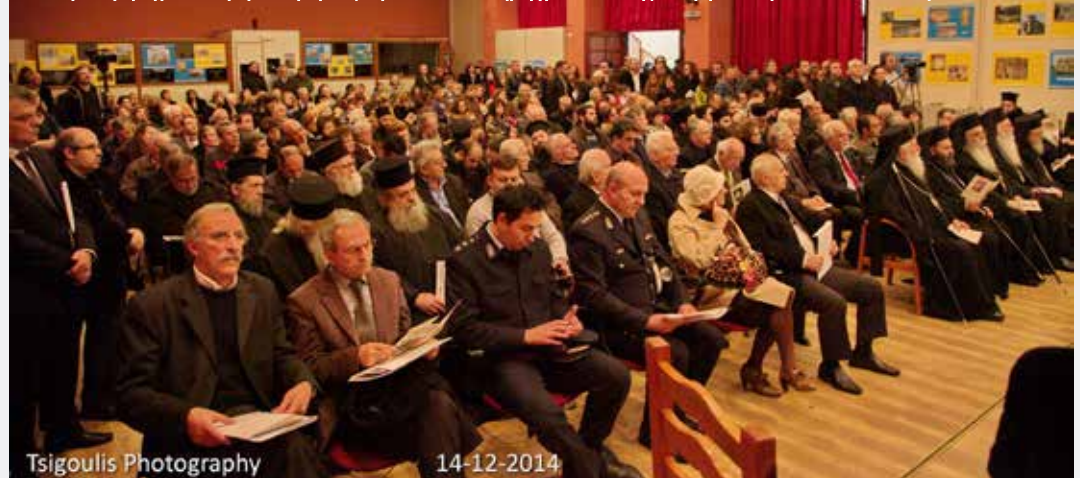
Η εκδήλωση πραγματοποιήθηκε στην φιλόξενη αίθουσα του Δημαρχείου Κονίτσης που γέμισε άσφυκτικά από τον κόσμο.

Κι εμείς, όσο κρατάμε την πίστη, την όμολογία και την προσευχή μας, δεν άποκάμουμε, γιατί πιστεύουμε ότι ο Σεβαστιανός ζεί. Μόνο που εμείς ζώντας στα έλληνοχώρια της γήινης σκλαβιάς μας, με σβησμένα τα φώτα των πνευματικών πόθων μας, σαν άλλοι φοβισμένοι βορειοηπειρώτες, ακούμε από το Μαυρόπουλο Πάσχα στις κορυφές της, στεντόρεια τη φωνή του να άντηχεί στα αυτιά μας παρηλλαγμένη: «Κουράγιο περιλειπόμενοι, άδελφοί μου, όσοι κρατείστε στην πίστη στο Χριστό και στην αγάπη στην Έλλάδα, μην άποκάμετε με όσα βλέπετε. Δεν είσθε μόνοι. Κοντά σας είναι ο Νικητής του Θανάτου, ο Άναστάς Κύριος. Σύντομα θα περάσει ο πνευματικός διωγμός και όλοι μαζί έν άγαλλιάσει θα ψάλλομε τον νικητήριο παιάνα: Χριστός Άνέστη και η Έλλάδα μας κι ο κόσμος μας Άνέστη!».