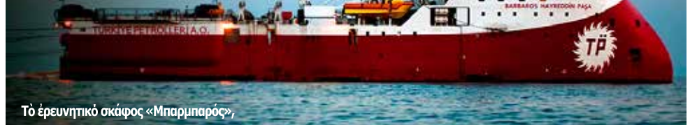
Τὸ ἐρευνητικὸ σκάφος «Μπαρμπαρός».

Ἐδῶ καὶ μερικὸς μῆνες, ἡ Τουρκία ἀπειλεῖ τὴν Κυπριακὴ Δημοκρατία μὲ κάποιου εἴδους ἐπέμβαση, ὥστε νὰ μὴν ἐρευνηθοῦν στὴν Νότια Κύπρο τὰ κοιτάσματα πετρελαίου καὶ φυσικοῦ ἀερίου. Γιὰ τὸν σκοπὸ αὐτό, καὶ μετὰ τὴν ἔναρξη γεωτρήσεων στὴν ΑΟΖ (Ἀποκλειστικὴ Οἰκονομικὴ Ζώνη) τῆς Κύπρου ἀπὸ ὁμάδα ξένων ἐταιρειῶν, βρίσκεται ἐκεῖ τὸ σκάφος «Μπαρμπαρός», πού στάλθηκε γιὰ νὰ πραγματοποιήσει σεισμικὲς ἐρευνες στὴν ΑΟΖ καὶ στὴν ὑφαλοκρηπίδα τῆς Κύπρου, γιὰ λογαριασμὸ τοῦ ψευδοκράτους.