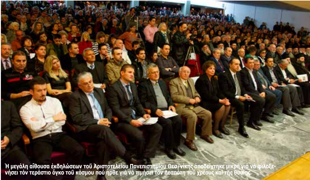
Η μεγάλη αίθουσα εκδηλώσεων του Αριστοτελείου Πανεπιστημίου Θεσ/νίκης αποδείχτηκε μικρή για να φιλοξενησει τόν τεράστιο όγκο του κόσμου που ήρθε για να τιμήσει τόν Δεσπότη του χρέους και τής θυσίας.

Με άρχιερατικό μνημόσυνο και μία μεγαλειώδη εκδήλωση, αντίξια τής προσφοράς του στην εκκλησία και την πατρίδα μας, ο κλήρος και ο λαός τής Θεσσαλονίκης τίμησε την μνήμη του μακαριστού Μητροπολίτη Δρυϊνουπόλεως, Πωγωνιανής και Κονίτσης, κυρού ΣΕΒΑΣΤΙΑΝΟΥ, με άφορμή την συμπλήρωση 20 ετών από την προς Κύριον εκδήμια του.