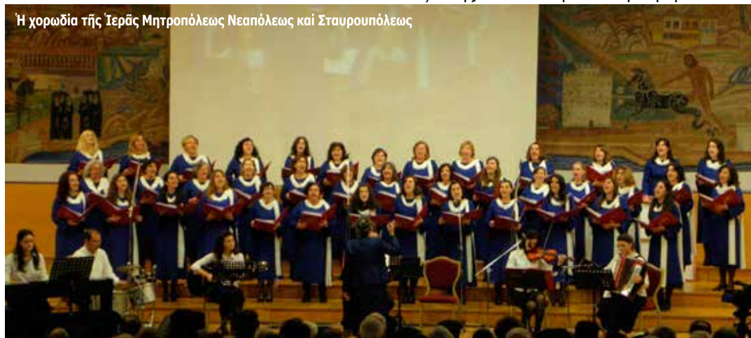
Η χορωδία της Ίερας Μητροπόλεως Νεαπόλεως και Σταυρουπόλεως

του κόσμου. Πάντα πρᾶος και δυναμικός μαζι. Ταπεινός και σεμνός παρά τη δημόσια προβολή του, ακούραστος παρά την άσθενική φύση του, ιεραποστολικός και μοναχός ταυτόχρονα. Η μυστική κραυγή της καρδιάς του πιο εύλογη από το χαρισματικό στόμα του. Ένας πονεμένος άρχοντας με εκείνο το έξυπνο χαμόγελο, άνθρωπος προσευχής και άλάνθαστης σκέψης. Λεβέντης πραγματικός!»