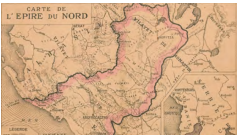
Γαλλικός χάρτης μέ περιοχές τής Βορείου Ήπειρου

Οί Μεγάλοι άρνήθηκαν τήν διεξαγωγή δημοψηφίσματος στην περιοχή, πίσω από όλα βρίσκονταν Ίταλία και Αυστροουγγαρία, αλλά και ή Ρουμανία που ήθελε νά μήν πάρει ή Έλλάς ούτε Ίωάννινα και Μέτσοβο! Ύπέρ τής Άλβανίας τέθηκαν και Τουρκοί και Βούλγαροι. Άπεστά-