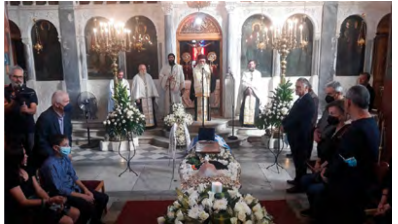
Στήν ἐξόδιο ἀκολουθία χοροστάτησε ὁ Μητροπολίτης Ἡλίας καί Ὡλένης κ. Ἀθανάσιος

Ὄταν τραυματιζόταν κανένας φαντᾶρος καί τόν ἔφερναν στά μετόπισθεν, ἐμεῖς τόν περιποιούμασταν μέ τά μέσα