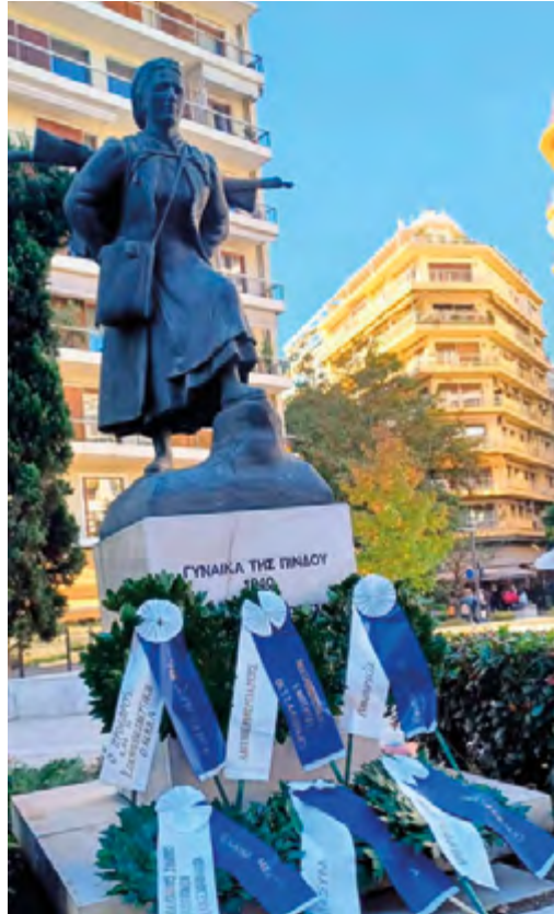
Λειτουργία. Στή συνέχεια στόν πα-

Στόν Ἱερό Ναό Νέας Παναγίας τελέστηκε μέ πρωτοβουλία τῆς Ἡπειρωτικῆς Ἑστίας Θεσσαλονίκης, ἡ δοξολογία μετά τή Θεία