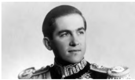
Ό Βασ. Κωνσταντίνος Β'

δος δέν σταματούν εδώ». Το 1967, έμφίσηθη το νέο αλβανικό σύνταγμα, με το οποίο η χώρα κατέστη το πρώτο άθεϊστικό κράτος παγκοσμίως. Μάλιστα, το άρθρο 37 έξομοίωσε τους Βορειοηπειρώτες με τους υπόλοιπους Αλβανούς, άπολύτως άντισυμβατικά. Η Αθήνα δέν άντέδρασε. Αντιθέτως, το 1971, προχώρησε στην αποκατάσταση των διπλωματικών σχέσεων, δίχως, όμως, να άρει το έμπολεμο ούτε να