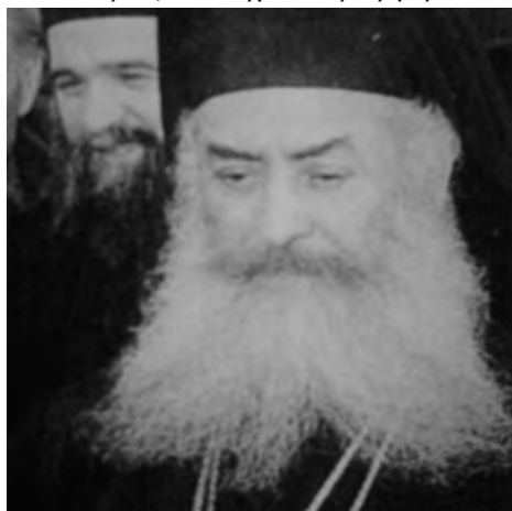
Ό μακαριστός Αρχιεπίσκοπος Αθηνών και πάσης Ελλάδος Σεραφείμ

Τετρακόσια χιλιάδες (400.000) Έλληνες Όρθόδοξοι, με μακράιωνα χριστιανική και ελληνική πολιτιστική παράδοση, ύποχρεώνονται βαναύσως να ζούν χωρίς Θεόν και θρησκείαν. Δέν ύπάρχει εκεί, ούτε εις Έπίσκοπος σήμερα. Άπαντες οι ιερείς άπεσηματίστησαν και οι ναοί εκλείσθησαν ή μετεβλήθησαν εις μουσειά και κέντρα ψυχαγωγίας. Τοιουτρόπως, επί σειράν έτών οι πιστοί μένουν άλειτούργητοι, άβάπτιστοι, άκήδευτοι, χωρίς Χριστούγεννα και Πάσχα και άλλας έορτάς. Συγχρόνως δε, κατά χιλιάδας έξορίζονται