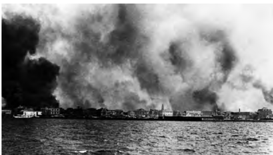
Ἡ Σμύρνη καίγεται!

«Ἡ συμπεριφορὰ τῶν Ἑλλήνων ἀπέναντι σὶς χιλιάδες τῶν Τούρκων πού κατοικοῦν στὴν Ἑλλάδα, ὅλο τὸ διάστημα πού γίνονταν οἱ θηριώδεις σφαγές καὶ ὅταν ἡ Σμύρνη καίγεται καὶ οἱ πρόσφυγες ἔφταναν σὲ ὅλους τοὺς λιμένες τῆς Ἑλλάδας πληγωμένοι, κακοποιοί-