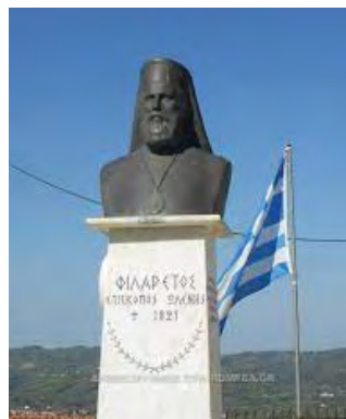
Ὁ ἐπίσκοπος Ὠλένης Φιλάρετος, ἕνα θῦμα τῆς φυλάκισης τῶν Τούρκων.

Ἀλλὰ στὴν Τριπολιτσά, ποὺ ἤδη ἀναφέραμε θὰ παιζόταν ἕνα ἄλλο τμῆμα τῶν γεγονότων τῆς ἐποχῆς. Φοβούμενοι οἱ Τούρκοι, ἀπὸ ὅσα ἤδη ἔφταναν στὰ αὐτιά τους, τὸν γενικὸ ξεσηκωμὸ τῶν ραγιαδῶν, κάλεσαν ἀπὸ τὴν ἀρχὴς Μαρτίου 1821 τοὺς Ἀρχιερεῖς καὶ τοὺς Προκρίτους τοῦ Μωριά στὴν Τριπολιτσά, ἔτσι ὥστε, κατὰ τὴν γνώμη τους, νὰ εἶναι ἀκέφαλοι οἱ ραγιαδες καὶ νὰ