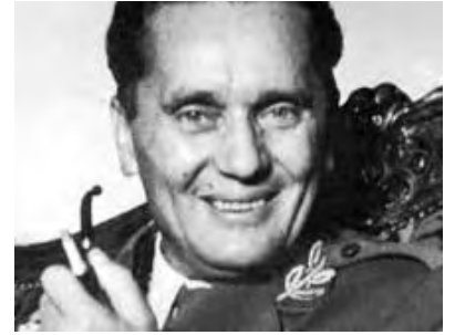
Ὁ Γιόζιπ Μπρόζ (Τίτο)

Ζ. ἡ ὁδὸς ἀπὸ καὶ πρὸς τοὺς Ἁγίους Σαράντα, ὅπως καὶ ἀπὸ τὰ Ἰωάννινα πρὸς Λεσκοβίκι – Κορυτσά – Φλώρινα, ἀποτελεῖ τὴν μόνην γραμμὴν ἐπικοινωνίας, ἐξυμνηρετοῦσα τὸ ἐμπόριο ὀλοκλήρου τῆς Ἠπείρου καὶ Μακεδονίας (Θεσσαλονίκης). Αὐτὴ ἡ ὁδὸς μετὰ τὴν παρούσα ὀριογραμμὴ ἔχει ἀποκοπεῖ.