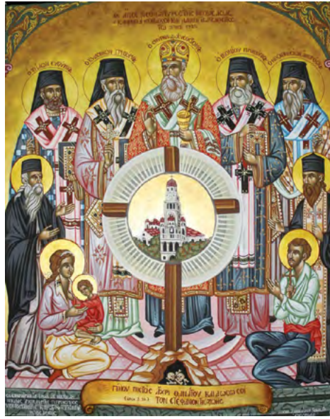
Εἰκόνα τῶν Ἁγίων Μαρτύρων τῆς Μικρᾶς Ἀσίας τὸ 1922

Κι ἐδῶ ἡ Ὁρθοδοξία συνέδεσε τὴν πορεία της μὲ τὸ Ἑλληνικὸ Γένος, στὰ εὐκόλα καὶ στὰ δύσκολα. Εἶναι γνωστὴ ἡ θυσία Ἱεραρχῶν καὶ κληρικῶν ἀπὸ τὸν Τουρκικὸ Ἐθνικισμό, πού κορυφώθηκε μὲ τὰ μαρτύρια Ὀσιακῶν μορφῶν τὸν Αὐγουστο καὶ Σεπτέμβριο τοῦ 1922,