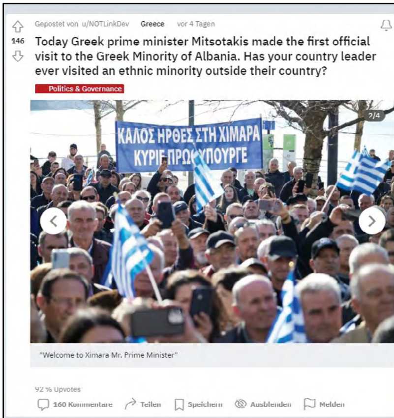
Από τη σελίδα REDDIT με δεκάδες σχόλια

ότι η Ελληνική Κυβέρνηση θα χτίσει σύντομα ελληνικό γυμνάσιο στη Χιμάρα» και ακόμα ότι «έπισκεφθηκε και την πόλη Φοινίκη, η οποία, από τους 61 δήμους της χώρας, είναι ο μόνος όπου δήμαρχος είναι Έλληνας του κόμματος ΜΕΓΑ». Ιδιαίτερες αναφορές και από τα τουρκικά μέσα όπου εκθειάζεται ο υπόλογος Ράμα και η Αλβανία για το σεβασμό των δικαιωμάτων των μειονοτήτων σε αντίθεση φυσικά με την Ελλάδα. Η σκηνοθεσία της επίσκεψης από αλβανικής πλευράς ερμηνεύεται άριστα από το τουρκικό αφήγημα και πρέπει να αναλυθεί ξεχωριστά αφού τα μηνύματα είναι πολυσήμαντα και δε συνίσταται η επιφανειακή προβολή τους. Από την άλλη αναφέρουν σαφώς ότι «ο κ. Μητσοτάκης επισκέφθηκε τη Βόρειο Ήπειρο (Kuzey Epir)», όρο που φοβούνται ακόμα και σήμερα να χρησιμοποιήσουν Έλληνες πολιτικοί ήγέτες! Αίνιγματική ή σιωπή των γερμανικών μέσων, με εξαίρεση τη δημόσια συμμετοχική ιστοσελίδα του