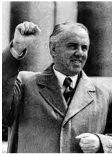
Ὁ Ἐμβέρ Χότζα

Τὸν Ἰούλιο τοῦ 1946, ἡ ἑλληνικὴ κυβέρνηση κατέθεσε μίαν ἐκθεση στὴν γραμματεία τοῦ συμβουλίου τῶν ὑπουργῶν Ἐξωτερικῶν τῶν τεσσάρων Μεγάλων Δυνάμεων στὸ Παρίσι. Κατωτέρω, παρατίθεται ἓνα ἀπόσπασμα ἀπὸ τὴν ἐκθεση αὐτὴ (σὲ ἀπόδοση στὴν δημοτικὴ).