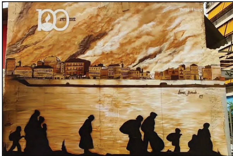
Σεπτέμβριος 1922. Ἡ Σμύρνη στὶς φλόγες

Ἦθελε, δηλαδὴ, νὰ τὸν θάψει ζωντανό. Ὁ ὄντας πού τὸν ἐτοίμασε ἦταν ὁ τάφος. Ἀλλὰ ἐκεῖνη τὴν στιγμὴ ὁ Γρηγόριος ἀπὸ τὴν δυνατὴ συγκίνησιν πού δοκίμασε, γιὰ ὅλα ὅσα συνέβαιναν, ἔπαθε συγκοπή, καὶ ἔπεσε νεκρὸς μπροστὰ στὸν τάφο του. Καὶ ἔκτοτε μένει ἄγρυπνος σκοπός, ἔξω ἀπὸ τὴν μαρτυρικὴ πόλιν τῶν Κυδωνιῶν καὶ περιμένει τὴν ἀνάστασιν τοῦ χριστιανισμοῦ στοὺς προαιώνιους ἐλληνικοὺς τόπους τῆς καθ’ ἡμᾶς χριστιανικῆς Ἀνατολῆς. Νὰ τὸ δώσει “ὁ καιροῦς καὶ χρόνους ἐν τῇ ἰδίᾳ ἐξουσίᾳ θέμενος” Κύριος Ἰησοῦς Χριστός. Νὰ δώσει, δηλαδὴ, κάποτε αὐτοὶ οἱ τόποι νὰ ἐλευθερωθοῦν. Νὰ τὸ δώσει ὁ Κύριος Ἰησοῦς Χριστός, τοῦ ὁποῖου ἡ Χάρις καὶ τὸ ἔλεος μὲ τὶς πρεσβεῖες τοῦ Ἁγ. Μητροπολίτου Κυδωνιῶν Γρηγορίου, εἶθε, ἀγαπητοὶ ἀδελφοί, νὰ εἶναι μετὰ πάντων ὑμῶν. Ἀμήν.