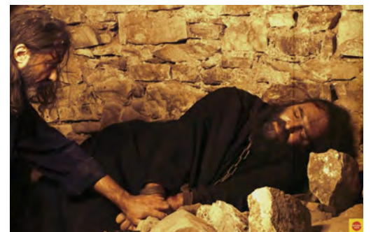
Ἀπὸ ταινία γιὰ τὰ βασανιστήρια τῶν Ἀρχιερέων καὶ προκρίτων στὴν Τριπολιτσά

Αὐτοὶ θὰ κρατηθοῦν ὄμηροι στὰ φρικτὰ μπουντρούμια τῆς Τριπολιτσᾶς, γιὰ νὰ περάσουν στιγμὲς γεμάτες ἀγωνία καὶ πόνο. Ἔχουν διασωθεῖ μαρτυρίες γιὰ τὴν συνθήκη κράτησης, ποὺ μᾶς