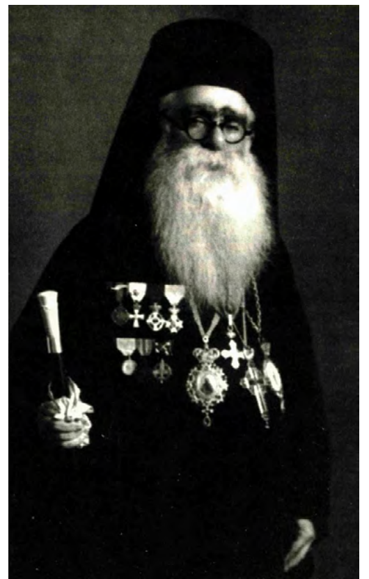
Ὁ μετέπειτα Θεσσαλιώτιδος Ἰεζεκιήλ (μὲ τὰ στρατιωτικά του παράσημα)

νὰ στηρίζει ψυχολογικά τοὺς Ἕλληνες στρατιῶτες μὲ τοὺς λόγους καὶ τὸ κήρυγμά του. Στὶς ἡμέρες τῆς Μικρασιατικῆς Καταστροφῆς ἦταν ἀπὸ τοὺς τελευταίους πού ἐγκατέλειψαν τὴν πόλη τῆς Σμύρνης, ὅταν ἤδη καιγόταν ἀπὸ τὰ τουρκικὰ ἀντάρτικα σώματα. Στὸν ἐπικήδειό του τὸ 1963 ὁ Ἡλεῖος λογοτέχνης Θεό-