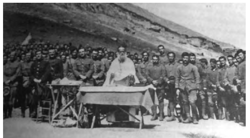
Ὑπαίθρια Δοξολογία στὸ Μέτωπο τῆς Μικρᾶς Ἀσίας

μήματα πού ὀπισθοχωροῦσαν μαχόμενα, μὲ τὴν βοήθεια τοῦ ἀποσπάσματος τοῦ Νικολάου Πλαστήρα, ἀποτελέσαντος τὴν ὀπισθοφυλακὴν τῆς ὀπισθοχωροῦσης στρατιᾶς». Γὰ τὴν προσφορά του τιμήθηκε μὲ τὸ