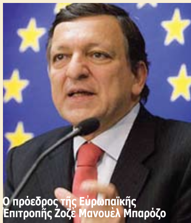
Ο πρόεδρος τής Ευρωπαϊκής Επιτροπής Ζοζέ Μανουέλ Μπαρόζο

Διάβημα Β/Ήπειρωτών ΗΠΑ πρὸς Μπαρόζο: Η Άλβανία άθετεί υποσχέσεις για τ'ανθρώπινα δικαιώματα ΠΣΕΒΑ: Τί πρέπει ν' άπαιτήσει από τούς γείτονες ή Ε.Ε..