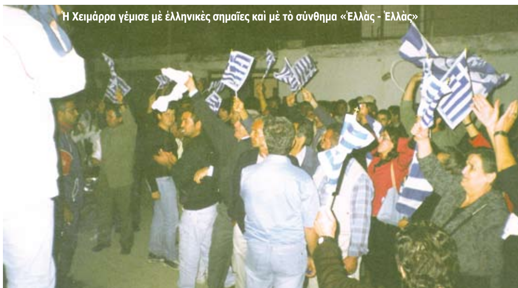
Η Χειμάρρα γέμισε με ελληνικές σημαίες και με τό σύνθημα «Έλλάς - Έλλάς»

Και όταν έκλεισε ή κάλπη, ήταν τής πρεσβείας αυτοί που τή μετέφεραν με τά ίδια τους τά χέρια στό Δημαρχείο, μέσα σέ ζητωκραυγές άπό τούς έκατοντάδες Χειμαριώτες «Έλλάς-Έλλάς», οι όποιοι ψάλλοντας πολλές φορές τόν έθνικό μας ύμνο, πλημμύρισαν τήν πόλη στό γαλανόλευκο μέχρι τό πρωί..... Μοναδικός άπάν ό τότε πρόεδρος τής Όμόνοιας και νΰν Βουλευτής του ΚΕΑΔ, που ενώ ήρθε τό άπόγευμα, όταν είδε τό κλίμα, τήν.... «έκανε» ωρίς, γιατί φοβήθηκε όπως έκμυστηρεύθηκε σέ φίλο του, ότι «... αυτοί είναι τρελλοί, θά κάνουν έπεισόδια..!».