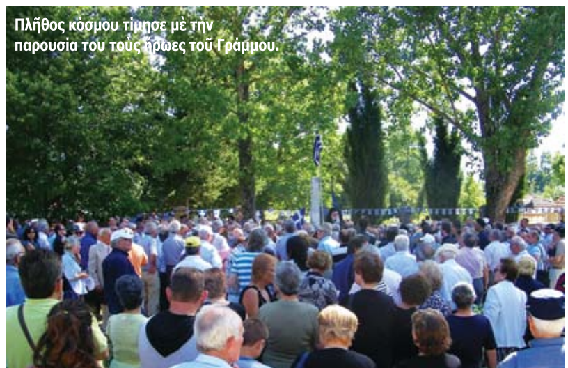
Πλήθος κόσμου τίμησε με την παρουσία του τους ήρωες του Γράμμου.