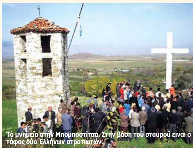
Τὸ μνημεῖο στὴν Μπομποσίτσα. Στὴν βάση τοῦ σταυροῦ εἶναι ὁ τάφος δύο Ἑλλήνων στρατιωτῶν.

Λίγες μέρες μετὰ τὴν βάνουση προσβολὴ εἰς βάρος τοῦ ἑλληνικοῦ νεκροταφείου στὴν Ἴμβρο, ἀπὸ τοὺς ἐξτρεμιστὲς ἔχουμε νέο περιστατικὸ σπύλωσης μνημείου τοῦ ἑλληνισμοῦ, τὶς μέρες ἀκριβῶς πού τιμοῦμε τὴν ἡρωικὴ ἐπέτειο τοῦ ΟΧΙ στὶς δυνάμεις τοῦ φασισμού. Συγκλονισμένο εἶναι τὸ ἑλληνικὸ στοιχεῖο στὴν περιοχή τῆς Κορυτσᾶς ἀπὸ τὴ χθεσινὴ (31-10-2010) βάνουση πρόκληση εἰς βάρος τῶν ἡρώων νεκρῶν τοῦ στρατοῦ μας ἀλλὰ καὶ τῆς ἐθνικῆς ἐπετείου τῆς πατρίδας μας. Σύμφωνα μὲ πληροφορίες, ἀφοῦ ὁλοκληρώθηκαν οἱ ἐκδηλώσεις (δοξολογία