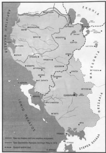
Η ενίαία Ήπειρος

Ο όρος «Βόρειος Ήπειρος» είναι μεταγενέστερος. Έπιβλήθηκε βίαια και αυθαίρετα τό 1913, όταν οι Μεγάλες Δυνάμεις (Αγγλία, Γαλλία, Γερμανία, Ρωσία, Ίταλία και Αυστροουγγαρία) διέπραξαν τό μεγάλο έγκλημα του διαμελισμού τής Ήπειρου και τής άποσπάσεως άπ' αυτήν τής Βορείου Ήπειρου. Μέχρι τότε και πριν χιλιάδες χρόνια, ή Ήπειρος ήταν ενίαία, μία και άδίαίρετη, που άρχιζε άπό τόν Άμβρακικό Κόλπο (Πρέβεζα) και τελείωνε στόν Γενοῦσο (Σκούμπι) ποταμό, παράλληλά τής Έγνατίας όδοῦ, με πρω-