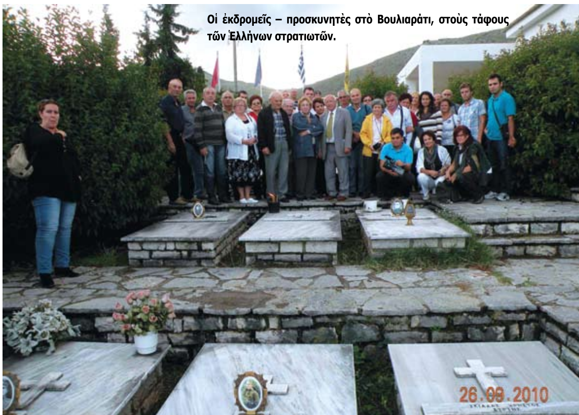
Οι έκδρομείς – προσκυνητές στο Βουλιάρατι, στους τάφους των Έλλήνων στρατιωτών.

Ένα ξεχωριστό διήμερο είχαμε την ευκαιρία να ζήσουμε, τα μέλη της ΣΦΕΒΑ Θεσσαλονίκης στις 25-26 Σεπτεμβρίου. Έπισκεφτήκαμε με καλούς φίλους και συνεργάτες από το Β' Δημοτικό Διαμέρισμα του Δήμου Θεσσαλονίκης την αγαπημένη γη της Βορείου Ηπείρου. Η αρχή είχε γίνει ένα χρόνο πριν με την κοινή χριστουγεννιάτικη επίσκεψη αγάπης στα μέρη της Κορυτσάς και τη συγκέντρωση μεγάλης ποσότητας σχολικής και γραφικής ύλης, παιχνιδιών αλλά και παιδικού ρουχισμού για το όρφανοτροφείο της Κορυτσάς. Η ποσότητα αυτή δεν ήταν δυνατόν να χωρέσει στο λεωφορείο που μās μετέφερε και έτσι αποτέλεσε τη μαγιά και την αφορμή για μία δεύτερη αποστολή από την άλλη, την παραλιακή, πλευρά της Βορείου Ηπείρου.