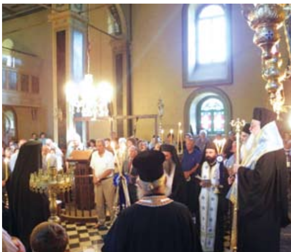
Τέλεση μνημοσύνου στον Ι.Ν. Κοιμήσεως Θεοτόκου στην Βούρμπιανη