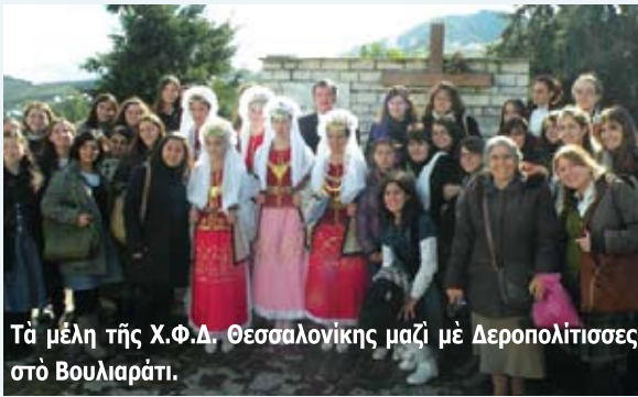
Τα μέλη της Χ.Φ.Δ. Θεσσαλονίκης μαζί με Δεσπολίτισσες στο Βουλιαράτι.

Η ΣΦΕΒΑ συμμετείχε και φέτος στον έορτασμό τής επέτειου του ΟΧΙ μέσα στον ιερό χώρο τής Βορείου Ηπείρου. Αύτη τή χρονιά συνοδεύσαμε και τήν αποστολή τών φοιτητριών τής Χριστιανικής Φοιτητικής Δράσης Θεσσαλονίκης.