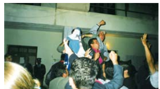
Κλιμάκιο του ΟΑΣΕ ήταν παρόν κατά τήν διάρκεια τής έκλογικής διαδικασίας.