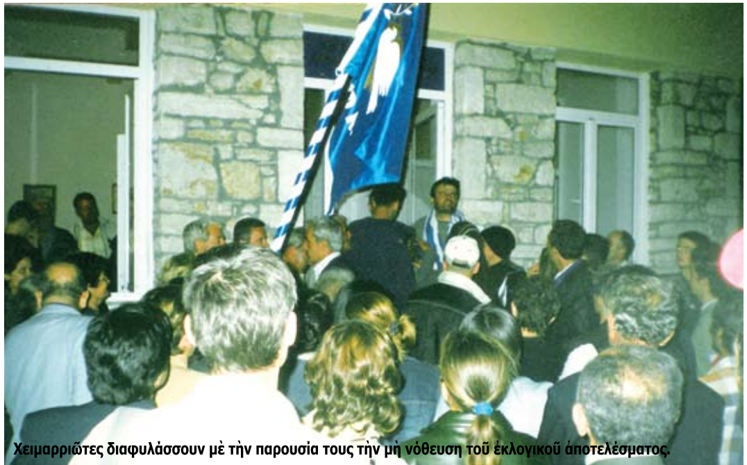
Χειμαρριώτες διαφυλάσσουν με τήν παρουσία τους τήν μή νόθευση του έκλογικού άποτελέσματος.

Μέσα στό έκλογικό τμήμα (ισόγειο σχολείου) παρακολουθεί πενταμελές κλιμάκιο τής άμερικάνικης πρεσβείας που σημειώνει, καταγράφει και έπικοινωνεί συνεχώς με κινητά τηλέφωνα με άνωτέρους τους προκειμένου να τηρηθεί άδιάβλητη ή διαδικασία, άλλά και όταν κλείνει ή κάλπη κι άρχίζει ή καταμέτρηση,