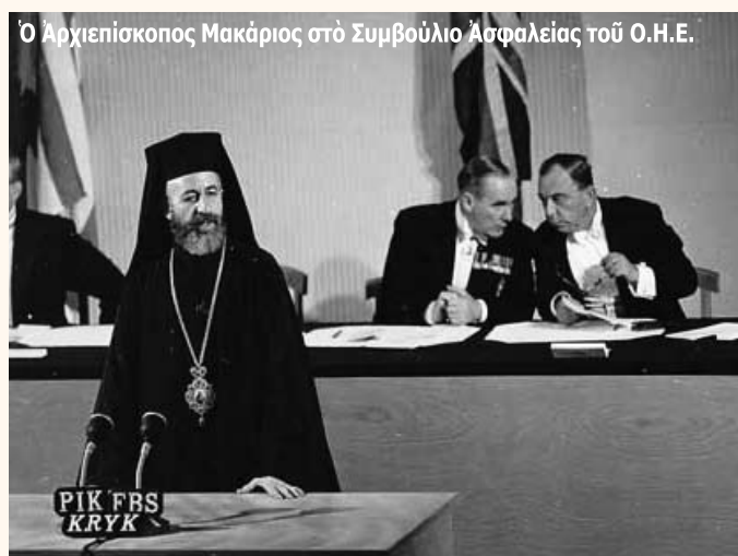
Ο Αρχιεπίσκοπος Μακάριος στο Συμβούλιο Ασφαλείας του Ο.Η.Ε.

Όλα τα κυπριακά κόμματα άντέδρασαν έντονα (πλήν του ΑΚΕΛ) για μιá περικοπή της όμιλίας του Προέδρου της Κυπριακής Δημοκρατίας κ. Δημ. Χριστόφια. Η όμιλία πραγματοποιήθηκε στο Ίνστιτούτο Μπρούκινγκς στην Ουάσιγκτων. Σύμφωνα, λοιπόν, με την όμιλία αυτή, το 1974 «στην πραγματικότητα οι άποκαλούμενες μητέρες πατρίδες (Ελλάδα και Τουρκία) εισέβαλαν στην Κύπρο».