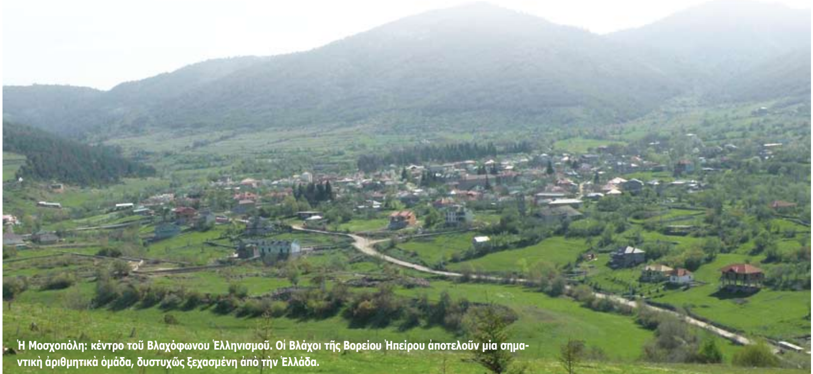
Ἡ Μοσχοπόλη: κέντρο τοῦ Βλαχόφωνου Ἑλληνισμοῦ. Οἱ Βλάχοι τῆς Βορείου Ἡπείρου ἀποτελοῦν μία σημαντικὴ ἀριθμητικὰ ὁμάδα, δυστυχῶς ξεχασμένη ἀπὸ τὴν Ἑλλάδα.