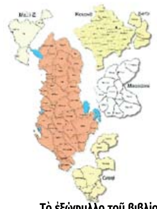
Τό έξώφυλλο του βιβλίου τής Γεωγραφίας που διδάσκεται στην Άλβανία.

Δέ χρειάζεται κανείς νά έχει ιδιαίτερες ιστορικές γνώσεις γιά νά άποκρούσει αυτές τις γελοιότητες. Όσοι γνωρίζουν λίγη ιστορία ξέρουν ότι πολλές πόλεις τής Άρχαίας Ήπειρου υπέφεραν άπό τις έπιδρομές τών Ίλλυριών, ενώ ή πόλη τής Χαονίας Φοινίκη, που ήταν κάποτε πρωτεύουσα τής Ήπειρου, καταστράφηκε όλοσχερώς άπό τους Ίλλυριούς. Αυτό που δέν καταλαβαίνουμε είναι τί κάνει ή Διακρατική Έπιτροπή τών Ύπουργείων Παιδείας τών δύο χωρών που είχε συσταθεί έπί ύπουργίας Άρσένη άκόμα, γιά τήν έξάλειψη έθνικιστικών αναφορών στα σχολικά έγχειρίδια. Έκτός και αν τά συγκεκριμένα κείμενα άπαλλάσσονται λόγο βλακειας γιαντί τά όρια του έθνικισμού τά ξεπερνούν!!!