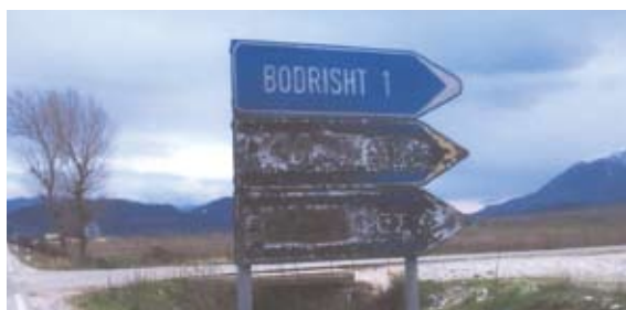
Βόρειος Ήπειρος. Άλβανοί έθνικιστές έσβησαν τις πινακίδες με τὰ έλληνικά γράμματα.