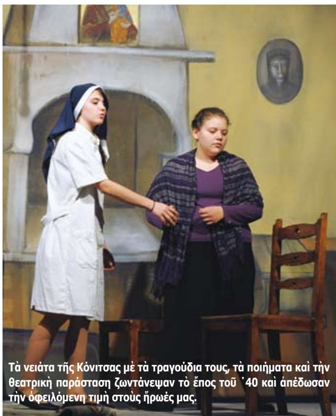
Τὰ νειάτα τῆς Κόνιτσας μὲ τὰ τραγούδια τους, τὰ ποιήματα καὶ τὴν θεατρικὴ παράσταση ζωντάνεψαν τὸ ἔπος τοῦ '40 καὶ ἀπέδωσαν τὴν ὀφειλόμενη τιμὴ στοὺς ἥρωές μας.

Θεοῦ καὶ δευτερον στὴν δική μας προσπάθεια. Εἰσαστε διαθεσιμὸι νὰ κάνετε αὐτὴ τὴν προσπάθεια; Νὰ εἶστε καλά, εὐλογημένα μου παιδιά. Νὰ μὴν ξεχάσετε αὐτὰ πού μᾶς παρουσιάσατε ἀπόψε, πού ἦταν ἰδιαίτερος συγκινητικὰ καὶ οἰκοδομητικὰ, καὶ νὰ θυμᾶστε ὅτι οἱ νέοι τοῦ '40, ὅπως εἶπε ὁ ἔθνικός μας ποιητής, ὁ Παλαμᾶς, ἐμέθυσαν μὲ τὸ κρασί τοῦ '21 καὶ ὅλοι ἔτρεξαν νὰ δώσουν τὸ παρὸν στὴν Πατρίδα πού κινδύνευε. Καὶ γι' αὐτὸ ἡ Ἑλλάδα ἔγραψε αὐτὸ τὸ ἔπος, πού τὸ ἐθαύμασε ὅλος ὁ κόσμος. Καὶ σεῖς, μπορεῖτε καὶ πρέπει νὰ γράψετε ἕνα νεώτερο ἔπος τὸ ὁποῖον θὰ καταπλήξει τὴν Εὐρώπη, ἡ ὁποία, δυστυχῶς, Εὐρώπη, ἐνῶ ἀπήλασε τοὺς καρπούς τῶν κόπων καὶ τῶν θυσιῶν τῆς Ἑλλάδος μετὰ τὴν ἐπρόδωσε καὶ τὴν προδίδει καὶ σήμερα. Εἶναι ντροπὴ μιὰ τέτοια τακτικὴ. Ἐσεῖς νὰ ξεπλύνετε τὴν ντροπὴ αὐτὴ. Χρόνια πολλά, λοιπόν, ἅγια, ἀγωνιστικά, καὶ κρατώντας στὸ χέρι σας δύο σημαίες: Στὸ ἕνα χέρι νὰ κρατᾶτε τὴν σημαία πού θὰ γράφει ΧΡΙΣΤΟΣ & ΟΡΘΟΔΟΞΙΑ, καὶ στὸ ἄλλο τὴν σημαία πού θὰ γράφει ΕΛΛΑΔΑ. Αὐτὲς τὶς δύο σημαίες κρατεῖστε τες καὶ δὲν θὰ μπορέσει νὰ τὶς πάρει κανεὶς.