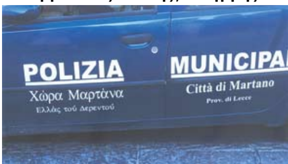
Κάτω Ίταλία. Διγλωσσες πινακίδες, στα Ίταλικά και στα έλληνικά!