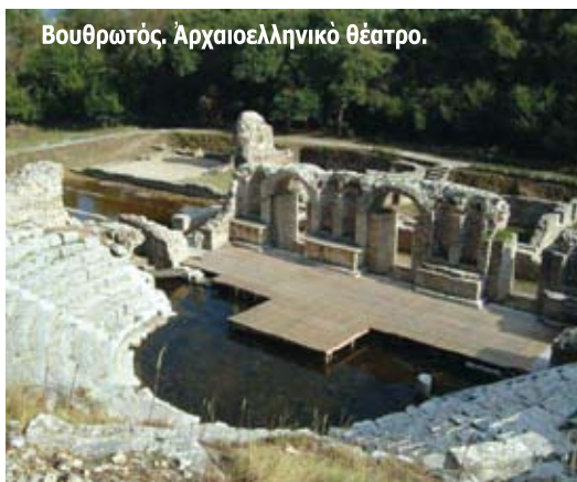
Βουθρωτός. Αρχαιοελληνικό θέατρο.

στους μαθητές του σχολείου, από τους οργανωτές της έκδρομής, έδωσαν, άσφαλώς, μεγάλη χαρά στα παιδιά, αλλά και στους γονείς την αίσθηση ότι δεν είναι μόνοι σ' αυτή τη χώρα. Βέβαια, το σχολείο επαναλειτούργησε το 2006 χάρη στον Αρχιεπίσκοπο ΑΝΑΣΤΑΣΙΟ (140 μαθητές).