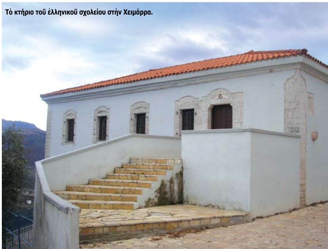
Το κτήριο του ελληνικού σχολείου στην Χειμάρα.

Είναι άκόμη πιο τραγική η μοίρα του Βορειοηπειρωτικού Έλληνισμού, διότι, ενώ ίδρυσαν διά των ήρωικών τους άγώνων, την «ΑΥΤΟΝΟΜΗ ΠΟΛΙΤΕΙΑ ΤΗΣ ΒΟΡΕΙΟΥ ΗΠΕΙΡΟΥ», τελικά μετέπεσαν στη μαύρη μοίρα μίας άγνοημένης και παραμελημένης μειονότητας