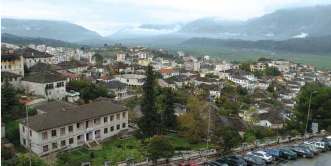
Άργυροκάστρο. Η πέτρινη πόλη.

«Λαός ἐλευθερωθεὶς διὰ τοῦ ξίφους δὲν δουλοῦται διὰ τοῦ καλὰμου» (Διακήρυξη Ἱερολοχιτῶν Βορειοηπειρωτῶν Φοιτητῶν Πανεπιστημίου Ἀθηνῶν, Ἀθήνα, Δεκέμ. 1913)