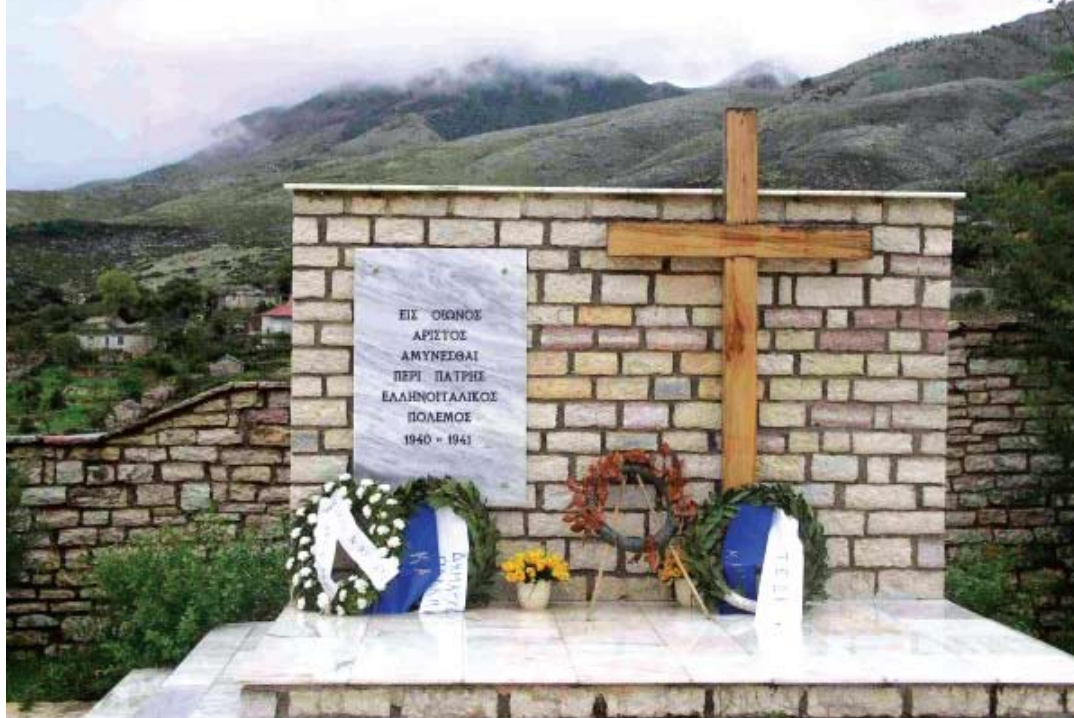
Βουλιάρατες. Στρατιωτικὸ κοιμητήριο Ἑλλήνων στρατιωτῶν πού ἔπεσαν μαχόμενοι τὸ 1940.

Πρῶτη, ἡ ΜΕΓΑΛΗ ΣΥΓΚΙΝΗΣΗ καὶ τὸ ΤΡΑΝΟ ΜΑΘΗΜΑ ἀπὸ τὴν Ἡρωικὴ ΧΕΙΜΑΡΑ (5.000 κατ.). Ἐδῶ, τὰ βιβλία καὶ τὰ ἄλλα δῶρα πού διανεμήθηκαν