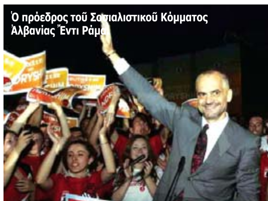
Ο πρόεδρος του Σοσιαλιστικού Κόμματος Αλβανίας Έντι Ράμα

Στην Αλβανία, η πολιτική κρίση δεν λείπει να σταματήσει. Πρόσφατα ο πρόεδρος του αντιπολιτευόμενου Σοσιαλιστικού Κόμματος, Έντι Ράμα, άνήγγειλε ότι η αλβανική αντιπολίτευση θα διοργανώσει μαζικές διαδηλώσεις, με στόχο την άπομάκρυνση της κυβερνήσεως του Σαλί Μπερίσα και την έξοδο της χώρας από την πολιτική κρίση. Όπως είναι γνωστό, τό Σοσιαλιστικό Κόμμα, τό όποιο καταλαμβάνει τις 65 από τις 140 συνολικά έδρες στην Βουλή της Αλβανίας, κατηγορεί τό Δημοκρατικό Κόμμα του Σαλί Μπερίσα ότι νίκησε στις περυσινές έκλογές με νοθεία και ζητεί έπανακαταμέτρηση των ψηφοδελτίων, ενώ η αλβανική κυβέρνηση άπορρίπτει τις κατηγορίες. Έξ άλλου, οι βουλευτές του Σοσιαλιστικού Κόμματος