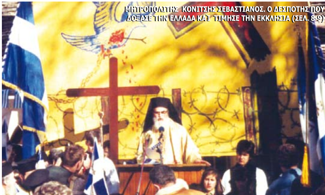
ΜΗΤΡΟΠΟΛΙΤΗΣ ΚΟΝΙΤΣΗΣ ΣΕΒΑΣΤΙΑΝΟΣ. Ο ΔΕΣΠΟΤΗΣ ΠΟΥ ΔΟΞΑΣΕ ΤΗΝ ΕΛΛΑΔΑ ΚΑΙ ΤΙΜΗΣΕ ΤΗΝ ΕΚΚΛΗΣΙΑ (ΣΕΛ. 8-9)