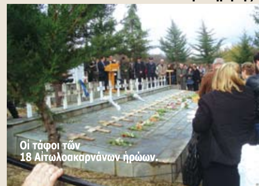
Οί τάφοι των 18 Αιτωλοακαρνανών ήρωων.