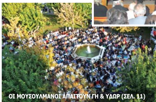
ΟΙ ΜΟΥΣΟΥΛΜΑΝΟΙ ΑΠΑΙΤΟΥΝ ΓΗ & ΥΔΩΡ (ΣΕΛ. 11)

«ΓΕΝΟΚΤΟΝΙΑ» ΤΗΣ ΕΛΛΗΝΙΚΗΣ ΜΕΙΟΝΟΤΗΤΑΣ ΤΗΣ ΑΛΒΑΝΙΑΣ ΑΠΟ ΤΟ... ΠΑΙΔΑΓΩΓΙΚΟ ΙΝΣΤΙΤΟΥΤΟ! (ΣΕΛ. 10)