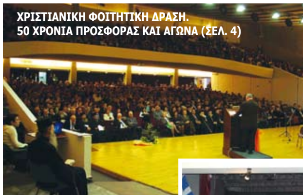
ΧΡΙΣΤΙΑΝΙΚΗ ΦΟΙΤΗΤΙΚΗ ΔΡΑΣΗ. 50 ΧΡΟΝΙΑ ΠΡΟΣΦΟΡΑΣ ΚΑΙ ΑΓΩΝΑ (ΣΕΛ. 4)