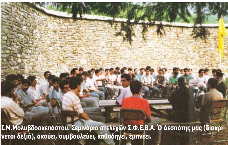
Ι.Μ.Μολυβδοσκεπιάστου. Σεμινάριο στελεχῶν Σ.Φ.Ε.Β.Α. Ὁ Δεσπότης μας (διακρίνεται δεξιὰ), ἀκούει, συμβουλευεῖ, καθοδηγεῖ, ἐμπνέει.

Βορειοηπειρώτες ἀδελφοί μας τιμοῦμε τίς θυσίες σας. Τιμοῦμε τίς θυσίες τῶν πατέρων καὶ τῶν