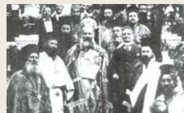
Ο Χρυσόστομος Σμύρνης άνάμεσα σέ ιερείς τής μητροπόλεώς του

«Ή συνθηδέστερη κατηγορία έναντίον τού Στεργιάδη ήταν ή μεροληψία του ύπερ τού τουρκικού στοιχείου, που έκδηλωνόταν κυρίως με πίεση στις άρμόδιες αρχές για τήν άθώωση Τούρκων κατηγορουμένων, και ή έπιμονή του άντίθετα για τή σκληρή τιμωρία των Έλλήνων ένόχων..... Ή ύπερβολή που, όπως καταγγέλλονταν όμόφωνα, χαρακτήριζε κάθε ένέργεια τού Στεργιάδη, έκδηλωνόταν και άπέναντι στόν κλήρο. Είναι γνωστή ή ρήξη του με τόν Μητροπολίτη Κυδωνιών Γρηγόριο, άκόμη και με τόν Χρυσόστομο Σμύρνης, τού όποίου δεν έδίστασε νά διακόψει κήρυγμα σέ έπίσημη δοξολογία