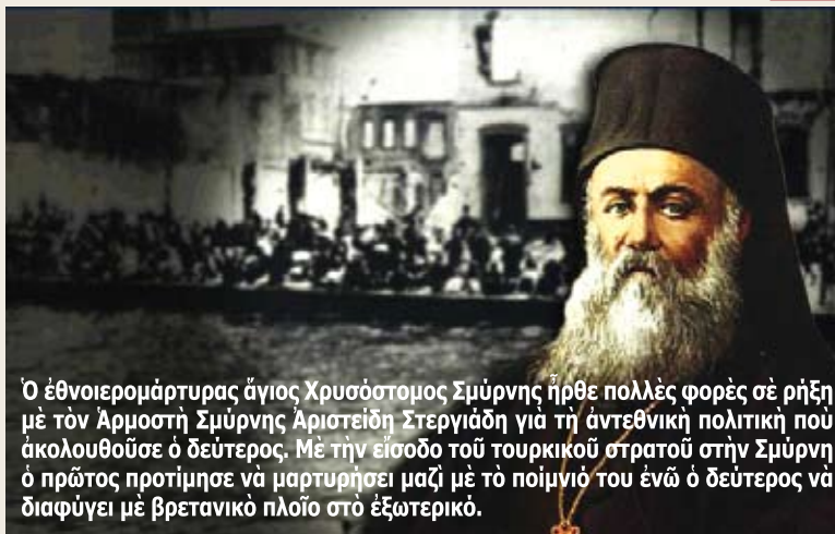
Ο έθνοειρομάρτυρας άγιος Χρυσόστομος Σμύρνης ήρθε πολλές φορές σέ ρήξη με τόν Άρμυστή Σμύρνης Άριστειδή Στεργιάδη για τή άντεθνική πολιτική που ακολουθούσε ο δεύτερος. Με τήν είσοδο τού τουρκικού στρατού στην Σμύρνη ο πρώτος προτίμησε νά μαρτυρήσει μαζί με τώ ποιμνίό του ένώ ο δεύτερος νά διαφύγει με βρετανικό πλοίο στώ έξωτετικό.

Κωνσταντίνος Χολέβας-Πολιτικός Έπιστήμων