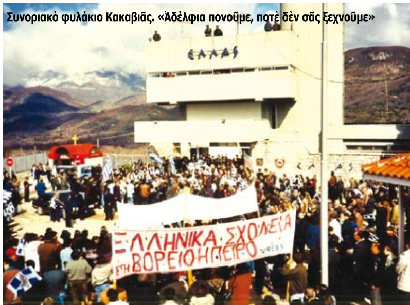
Συνοριακὸ φυλάκιο Κακαβιάς. «Ἀδέλφια πονοῦμε, ποτὲ δὲν σᾶς ξεχνοῦμε»

ἀδελφῶν σας. Τιμοῦμε τὸ αἷμα, τὰ μαρτύρια, τίς φυλακίσεις, καὶ τίς ἐξορίες. Τιμοῦμε τοὺς ἐμπτυσμοὺς καὶ τὰ ραπίσματα ποὺ ὑπέστητε κατὰ τὴ διάρκεια τῆς μακραιωνῆς δουλείας σας.