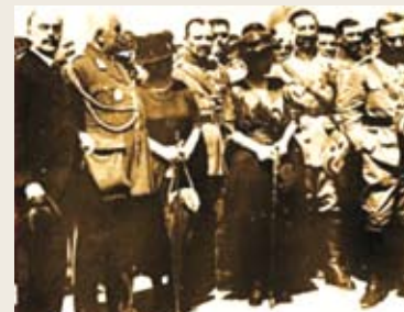
Ο Άριστειδης Στεργιάδης (πρώτος άριστερα) μαζί με Έλληνες στρατιωτικούς

για τόν έορτασμό τής νίκης, έπειδή κατά τή γνώμη του τώ περιεχόμενο ξεφευγε από τά θρησκευτικά πλαίσια και έπαιρνε τή μορφή έθνικοπατριωτική πολιτικο-