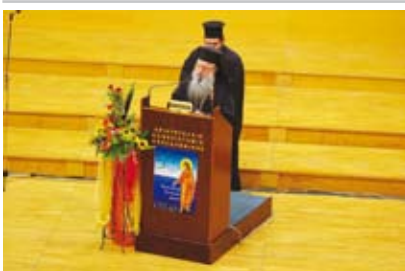
Ο Παναγιώτατος Μητροπολίτης Θεσ/νίκης κ. Άνθιμος (πάνω) και ο Μητροπολίτης Ναυπάκτου κ. Γερόθεος (κάτω) που υπήρξαν μέλη τής Χ.Φ.Δ., χαιρέτησαν την έκδήλωση.