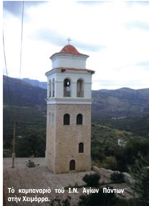
Το καμπαναριό του Ι.Ν. Αγίων Πάντων στην Χειμάρα.

είναι Έλληνες), με το βυζαντινό κάστρο του 13ου αι. και τη βυζαντινή, γενικά, άρχιτεκτονική, ήταν η έδρα της Αυτόνομης Πολιτείας της Βορείου Ηπείρου, που ίδρύθηκε το 1914, αλλά έμεινε στα χαρτιά, όπως σημειώσαμε παραπάνω. Σήμερα είναι έδρα