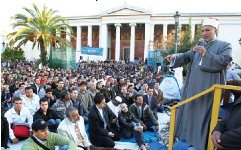
Χιλιάδες Μουσουλμάνοι μετανάστες μαζεύτηκαν στις 11.9.2010, στα Προπύλαια του Πανεπιστημίου Αθηνών (φωτό) αλλά και σε άλλα κεντρικά σημεία της πρωτεύουσας για να προσευχηθούν αλλά και για να επίδειξουν την δύναμή τους.

Αν κανείς περνούσε το πρωί της 11ης Νοεμβρίου 2010 από τις κεντρικές πλατείες –και όχι μόνο- των Αθηνών θα νόμιζε ότι βρίσκεται σε Μουσουλμανική χώρα. Ο άνωτέρω χαρακτηρισμός δεν αποτελεί υπερβολή ή σενάριο κάποιας ταινίας φαντασίας, αλλά γεγονός αφού συνέβη στην πρωτεύουσα της πατρίδας μας. Και εξηγούμεθα: