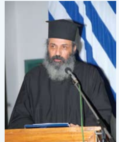
Ὁ κεντρικὸς ὁμιλητὴς τῆς ἐκδηλώσεως, ἀρχιεπίσκοπος π. Ἐπιφάνιος Χατζηγιάνγκου.