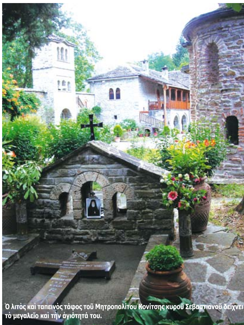
Ὁ λιτὸς καὶ ταπεινὸς τάφος τοῦ Μητροπολίτου Κονίτσας κυροῦ Σεβαστιανοῦ δείχνει τὸ μεγαλεῖο καὶ τὴν ἀγιότητά του.