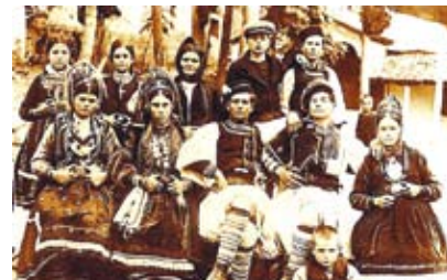
ΟΙ ΒΛΑΧΟΦΩΝΟΙ ΗΠΕΙΡΩΤΕΣ ΣΤΥΛΟΒΑΤΕΣ ΤΟΥ ΕΛΛΗΝΙΣΜΟΥ ΣΤΗ ΒΟΡ. ΗΠΕΙΡΟ (ΣΕΛ. 3)

60 ΧΡΟΝΙΑ ΑΠΟ ΤΟ ΕΝΩΤΙΚΟ ΔΗΜΟΨΗΦΙΣΜΑ ΤΗΣ ΚΥΠΡΟΥ. ΕΚΔΗΛΩΣΗ ΤΙΜΗΣ ΚΑΙ ΜΝΗΜΗΣ ΑΠΟ ΤΗΝ ΜΗΤΡΟΠΟΛΗ ΚΟΝΙΤΣΗΣ (ΣΕΛ. 6-7)