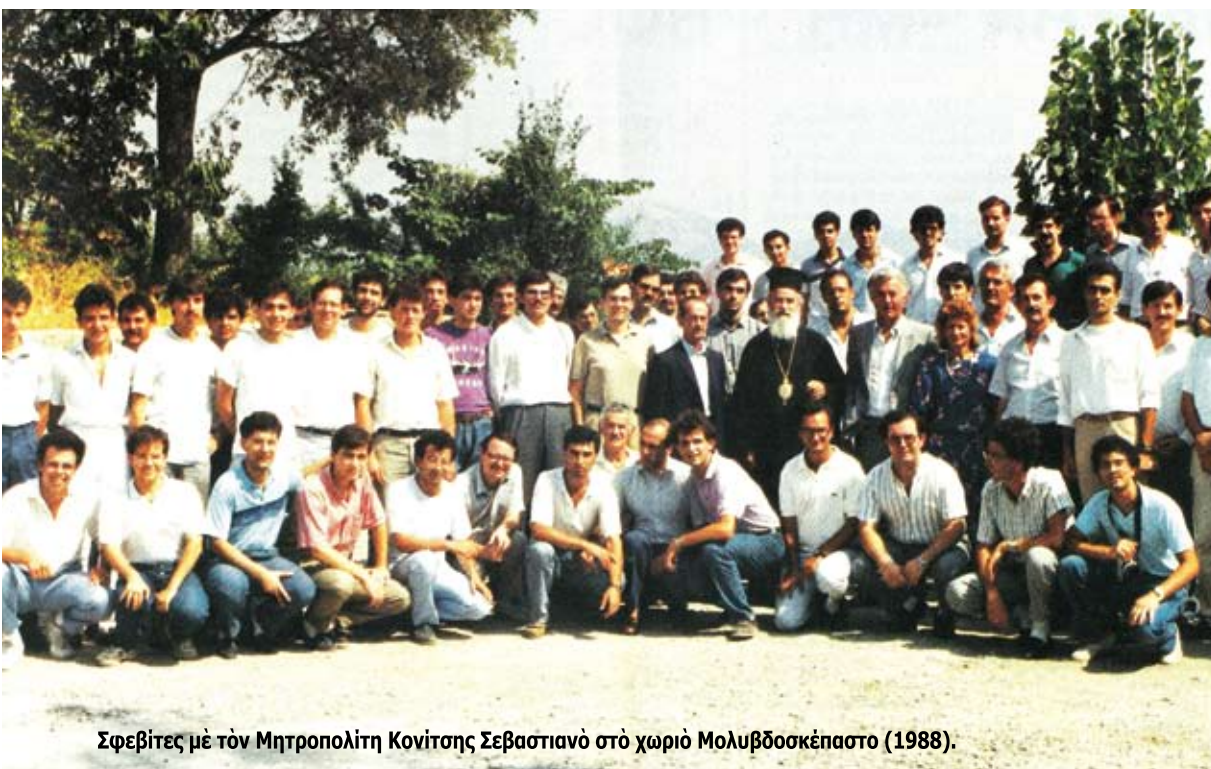
Σφεβίτες με τόν Μητροπολίτη Κονίτσας Σεβαστιανό στο χωριό Μολυβδοσκεπάστο (1988).

Μετά τόν πανευρωπαϊκό γκρέμισμα τών τειχών και τήν πτώση τών ήλεκτροφόρων συρματοπλεγμάτων στις άρχες τις δεκαετίας του '90, ο Σεβαστιανός, πρώτος από όλους και μπροστά από τις έξελίξεις, διαγιγνώσκει έγκαίρως τόν κίνδυνο που συνεπάγεται για τή Βόρειο Ήπειρο ή πληθυσμιακή αίμορραγία από τά ζωτικά παραγωγικά της κύτταρα και άγωνίζεται άσθενής πλέον στο σώμα, μά πάντα άκμαίος στην ψυχή, για τήν ένότητα του Βορειοηπειρωτικού Έλληνισμού, για τήν παραμονή του στις πατρογονικές έστίες, για τήν κατοχύρωση του άναφαίρετου ανθρώπινου δικαιώματος τών άδελφών μας να ζούν ως έλεύθεροι άνθρωποι, πέφτοντας κυριολεκτικά στις έπάλξεις του πνευματικού και έθνικού άγώνα. Η άπέρριπτη και ταπεινή διαθήκη του