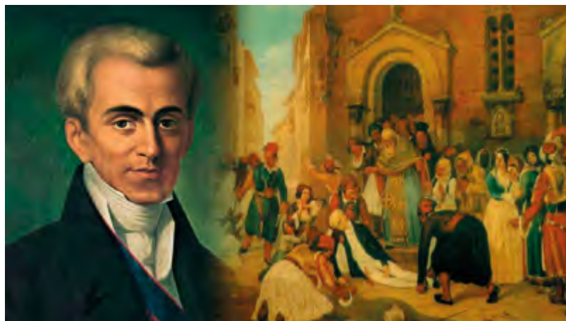
Ἀκόμα καὶ οἱ ἐπικριτὲς του ἀναγνωρίζουν τὸν πατριωτισμὸ τοῦ Καποδίστρια

Ἡ μνήμη του, μνήμη ἐνάρετου καὶ ἀγωνιστοῦ Ἱεράρχου, νὰ εἶναι ἀγήρω καὶ αἰώνια.