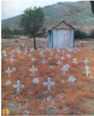
Ὁ χώρος τοῦ κοιμητηρίου ὅπως τὸν διατήρησαν οἱ Βορειοηπειρώτες πρὶν "ἀνοίξουν" τὰ σύνορα.