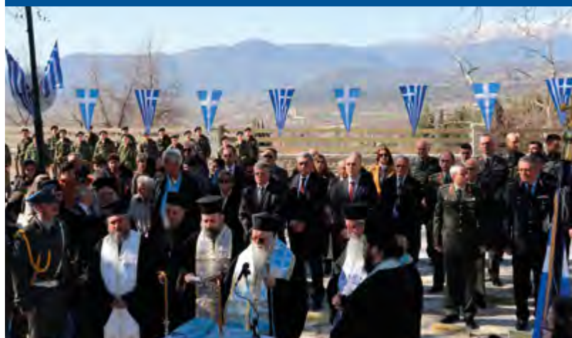
Τιμῶντας τὰ ἐλευθέρια τῆς Κονίτσης