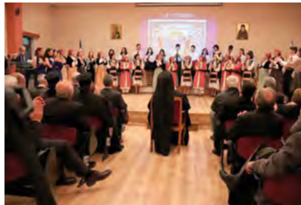
Χορωδιακό και χορευτικό συγκρότημα του Λυκείου Λινόπετρας Λεμεσού Κύπρου

Εύχομαι, λοιπον, ο Χριστός και ή Παναγία να είναι μαζί σας, να σας εύλογεί και όπου αν τυχόν βρεθείτε, έξω από την Κύπρο, να