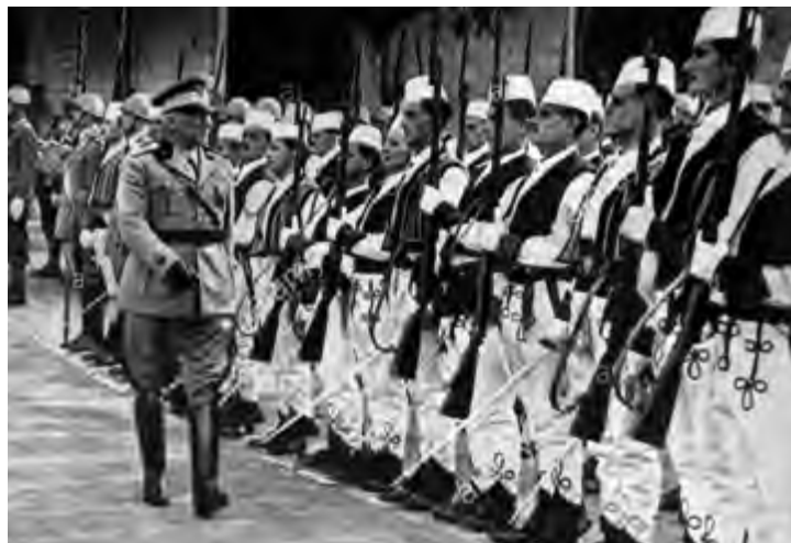
Ο Στρατηγός Αλφρέντο Γκουτσόνι έπιθεωρεί μονάδες Άλβανών συνεργατών της ίταλικής διοικήσεως.

Τ ήν Μεγάλη Παρασκευή 7 Απριλίου 1939, Ιταλικά στρατεύματα υπό τον Στρατηγό Αλφρέντο Γκουτσόνι (Alfredo Guzzoni) άπεβιάσθησαν στους άλβανικούς λιμένες και σε σύντομο χρονικό διάστημα έθεσαν υπό τον έλεγχο τους όλη την χώρα 1 . Οι συνολικές άπώλειες και από τις δύο πλευρές ανήλθαν σε 13 νεκρούς. Ο Βασιλεύς Ζώγου κατέφυγε με την οικογένειά του στην Ελλάδα αλλά ή κυβέρνηση φρόντισε να τον στείλει στην Τουρκία για να άποφύγει οιαδήποτε περιπλοκή με την Ρώμη. Την 12η Απριλίου, το άλβανικό κοινοβούλιο έτάχθη υπέρ της ένωσης των δύο κρατών και κατόπιν διελύθη! Προσωρινώς, ή έξουσία θα άσκειτο από τον Σεφκέτ Βερλάτσι. Οι Ένοπλες Δυνάμεις και ή διπλωματική ύπηρεσία έτέθησαν υπό τις διαταγές των Ιταλών. Την 16η Απριλίου, μία έπιτροπή Άλβανών μετέβη στο Κυρηνάιο μέγαρο και προσέφερε τα στέμματα της χώρας στον Ιταλό ήγεμόνα. Τέλος, την 3η Ιουνίου, ο άλβανικός στρατός ένωματώθηκε στον αντίστοιχο ίταλικό, συγκροτώντας την 6η Στρατιά, ενώ άπεφασίσθη ή κοινή διεθνής έκπροσώπηση της χώρας. Επίσης, ο Ιταλός μονάρχης παρεχώρησε στους Άλβανούς νέο συνταγματικό χάρτη, ενώ ο Φραντσέσκο Τζακομόνι ντι Σάν Σαβίνο (Francesco Jacomoni di San Savino) διορίστηκε στην θέση του τοποτηρητή. Τέλος, οι Ιταλοί διόρισαν 4 Άλβανούς ως μέλη της ίταλικής Γερουσίας, ενώ ένα τάγμα του άλβανικού στρατού μετεκινήθη στη Ρώμη για να άποτελέσει τμήμα της Αύτοκρατορικής Φρουράς. Ο Ζώγου διέφυγε στην Ελλάδα, άπ' όπου μετέβη στην Αίγυπτο 2 .