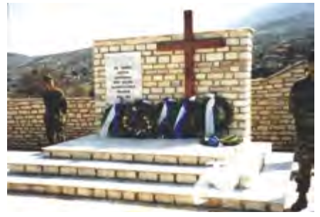
Τὸ ἥρωον ποὺ βρίσκεται στὸ χωριὸ τοῦ στρατιωτικοῦ νεκροταφείου