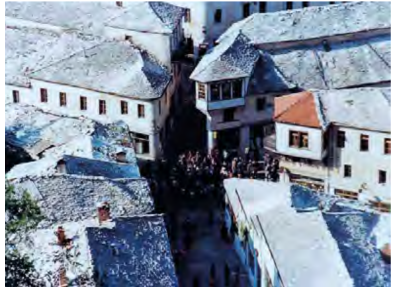
Ἦταν ἴσως τότε τὸ Ἀργυροκάστρο ἀπὸ ψηλά, σαφῶς καὶ ἔχει ἀλλάξει σήμερον.

Στὸ ἴδιο ξενοδοχεῖο, ἀπὸ ὅ,τι ἔμαθα, εἶχε καταλύσει λίγους μῆνες νωρίτερα ἡ πρώτη πολυμελὴς ἑλληνικὴ ἀντιπροσωπεία μετὰ ἐπικεφαλῆς τὴν Μελίνα Μερκούρη, πού ἐπισκέφθηκε τὴ γειτονικὴ χώρα, σὲ μίαν πρώτη προσπάθεια ἐξομάλυνσεως μεταξὺ τῶν δύο χωρῶν.