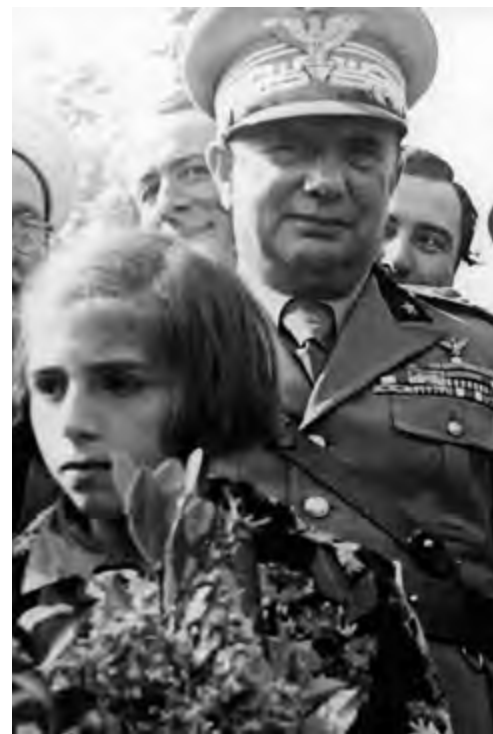
Η άφιξη του Στρατηγού Αλφρέντο Γκουτσόνι στην Άλβανία, λίγο μετά την κατάληψη της τελευταίας από τα ίταλικά στρατεύματα, τον Απρίλιο του 1939.

Καθίσταται προφανές ότι ο άλυτρωτισμός των Τσάμηδων έτέθη υπό την άποκάλυπτη προστασία των Ιταλών. Αυτό έμελλε να άποδειχθεί σε άρκετές περιπτώσεις έως και σήμερα. (συνεχι-