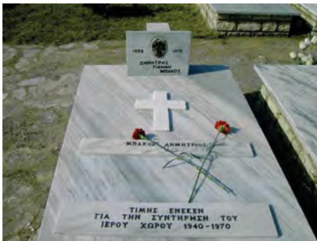
Ὁ τάφος τοῦ Δημητρίου Μπάκου

Ὅταν τὸν ρωτοῦσαμε ἂν κουράζεται ἀπὸ τὸ διακόνημά του αὐτὸ, μᾶς ἀπαντοῦσε ἐμφατικὰ: Οἱ ἥρωες αὐτοὶ δώσανε τὰ νιάτα τους γιὰ τὴν ἐλευθερία τῆς Ἑλλάδος ἀλλὰ καὶ τὴ δική μας καὶ ἐγὼ θὰ σκεφτῶ τὴν ὥρα ποὺ θὰ ἀφιερῶσω γιὰ νὰ ἔλθω νὰ ἀνοίξω τὸ νεκροταφεῖο γιὰ νὰ προσκυνήσετε;