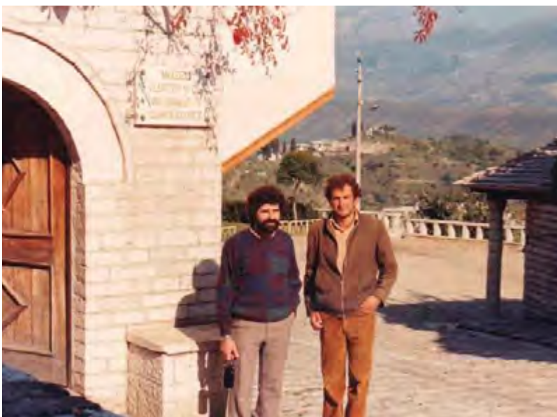
Ένας όμογενής κάτοικος Αλβανίας, ανέλαβε να ξαναγήσει τόν ύποφαινόμενο στην κατοικία-μουσείο του Ένβερ Χότζα, Οκτώβριος του 1987, αρκετά χρόνια πριν ανοίξουν τὰ σύνορα και οι Αλβανοί πολίτες βγούν από τή χώρα τους.

παιχνίδι τής τοπικής ομάδας με τόν ΠΑΟΚ.