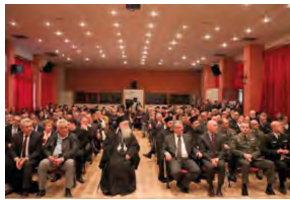
Η αίθουσα Εκδηλώσεων του Δημαρχείου ύπερπλήρης

ρούν πιο πάνω, όπου υπάρχει μια γή πολύπαθη σαν την Κύπρο. Είναι ή γή