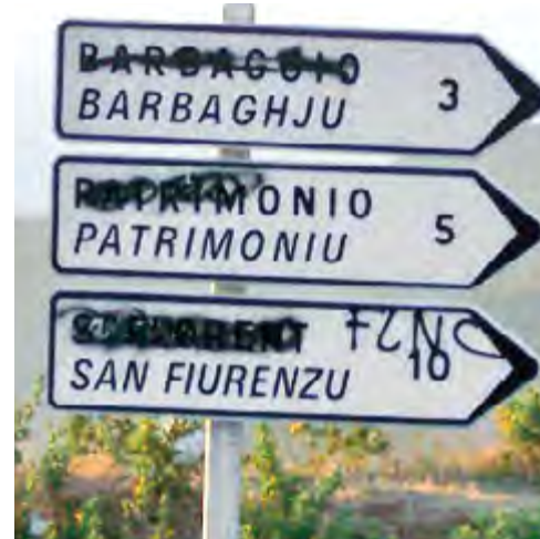
Τὸ γνωστὸ πρόβλημα μετὰ τίς σβησμένες δίγλωσσες πινακίδες ὅπως στὴ Βόρειο Ήπειρο καὶ στὴν Κορσική...

Τὸ ζήτημα τῆς διαφύλαξης τοῦ ἑλληνικοῦ χαρακτήρα τῆς Βορείου Ἡπείρου εἶναι ζωτικὸ ἀκόμα καὶ γιὰ αὐτοὺς πού ἐπὶ τοῦ παρόντος δὲ θὰ ψήφισαν “Ναί” σὲ κάποιο δημοψήφισμα Αὐτοδιάθεσης τῆς